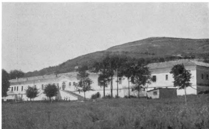
Здание инв. дома въ Шуменѣ.