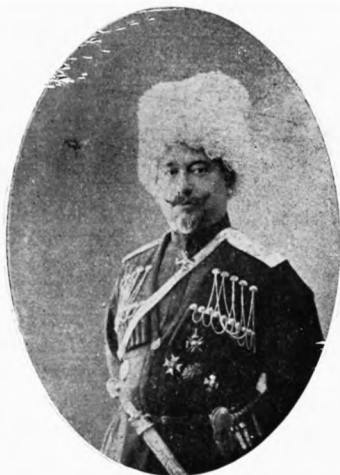
Генераль-отъ-кавалеріи Н. Н. Баратовъ.

Совсѣмъ въ другомъ положеніи находились инвалиды. Многіе изъ нихъ еще лежали на больничныхъ кроватяхъ. Никакихъ средствъ не было и не могло быть. Ни на какую государственную помощь рассчитывать они не могли. Россія была далеко, государственная власть перестала суще-