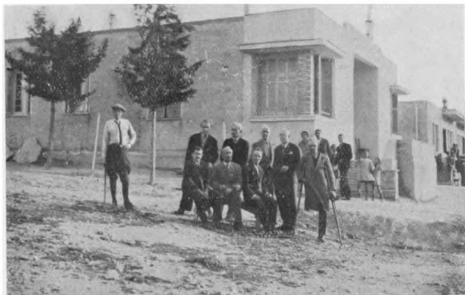
Зданіе инв. дома въ Афинахъ.