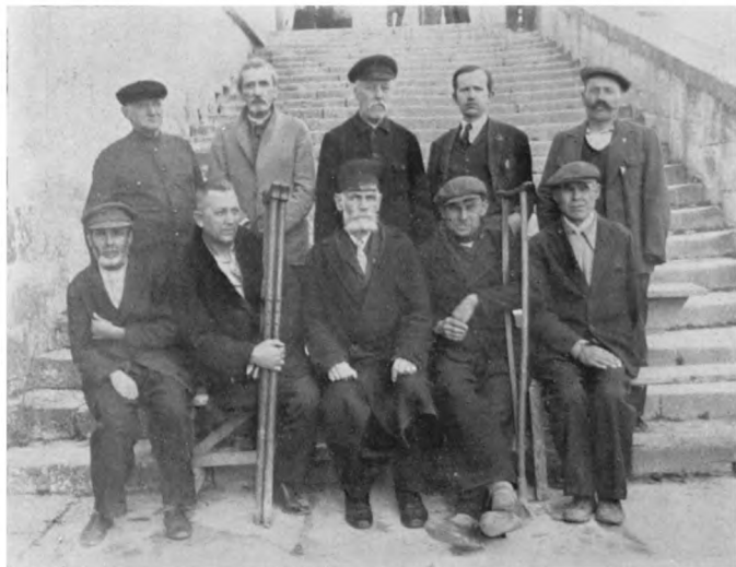
Група инвалидовъ въ инв. домъ въ г. Шуменъ (Болгарія).