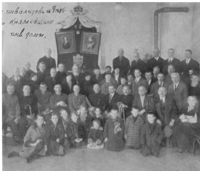
Група инвалидовъ въ Княжево (Болгарія).