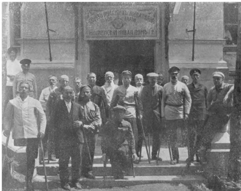
Группа инвалидовъ въ Болгаріи.