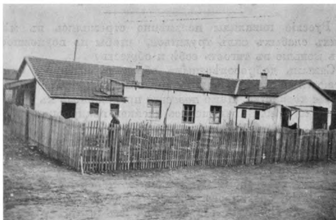
Инвалид. домъ въ Салоникахъ.