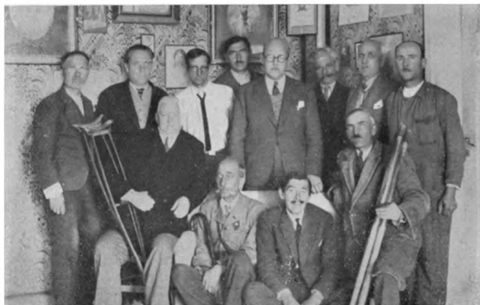
Група инвалид. въ Инв. домъ въ Афинахъ.