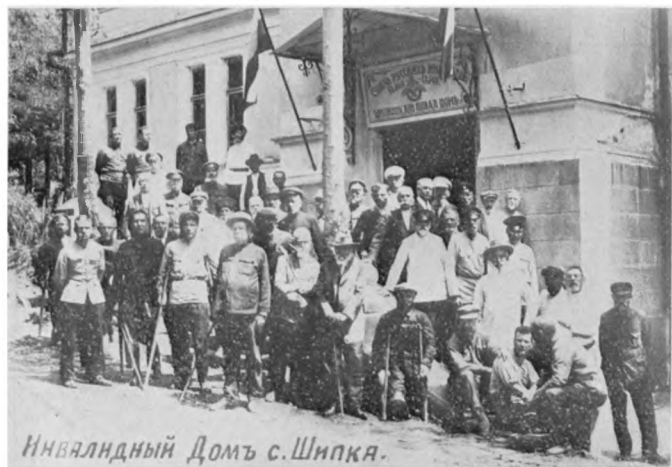
Инвалидний Домъ с. Шипка.