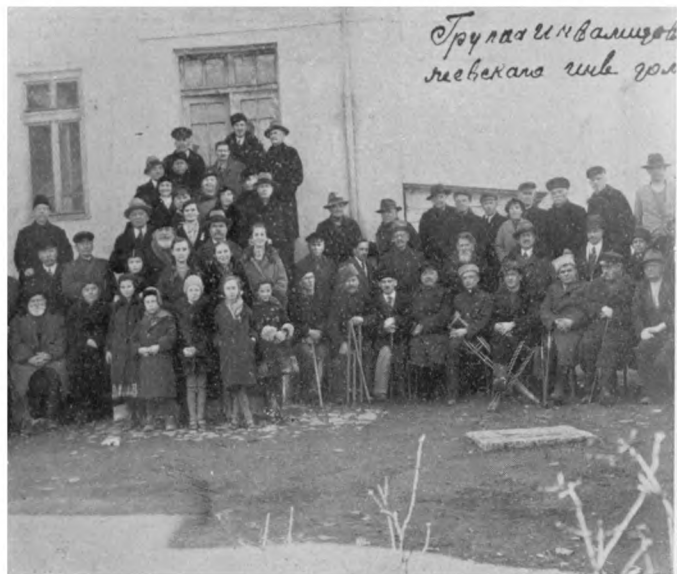
Група инвалидовъ въ Княжево (Болгарія).