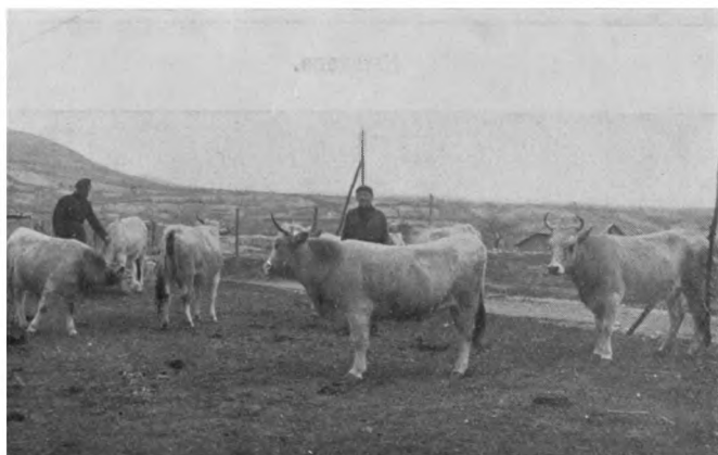
Шуменский инв. домъ. Молочное хозяйство