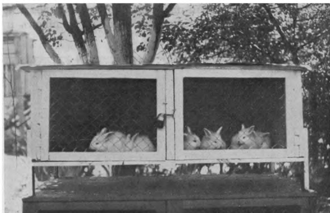
Княж. инв. домъ. Кролиководство.