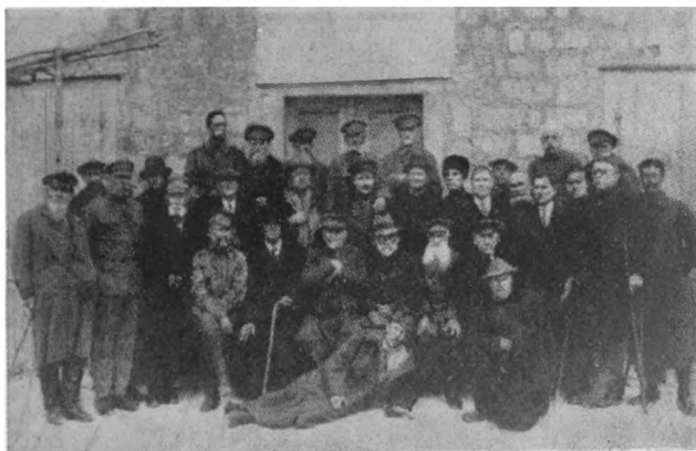
Группа инвалидовъ въ Пречаны (Югославія).