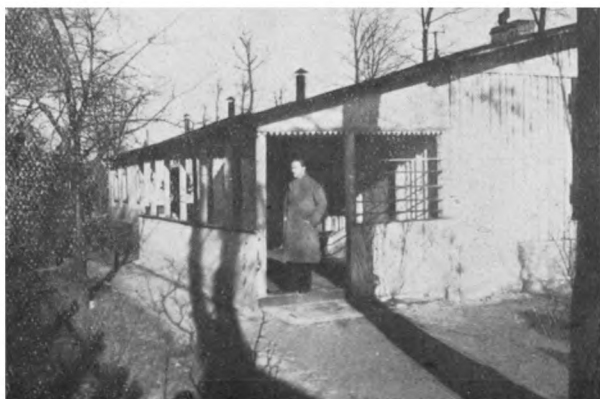
Зданіе инв. убъжища на кладбищѣ Тегель. (Германія).