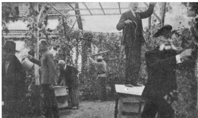
Подвязка винограда въ инв. домѣ въ Салоникахъ.