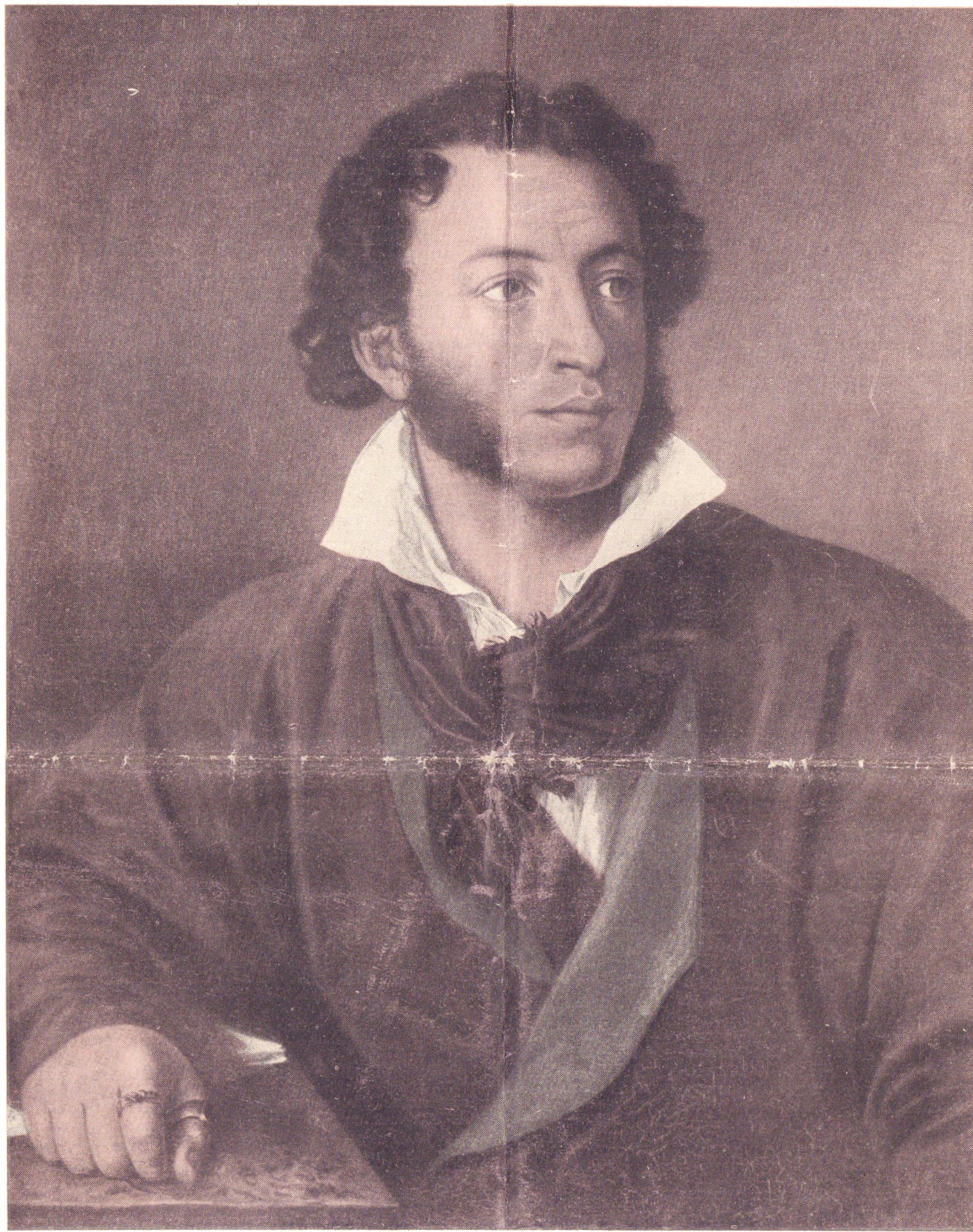
А. С. Пушкин. Портрет работы В. А. Тропинина

*) Идя навстречу пожеланиям наших читателей, мы решили повторить напечатанную в прошлом году ко Дню Русской Культуры статью Ф. А. Степуна, а также еще раз воспроизвести портрет Пушкина работы В. А. Тропинина.