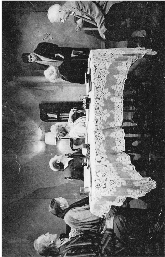
«Первое апреля», Ингер-Арт Театр, Нью-Йорк, 1975 г.