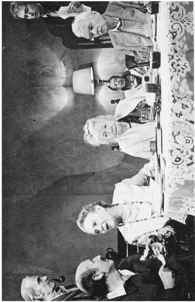
«Первое апреля», Интер-Арт Театр, Нью-Йорк, 1975 г.