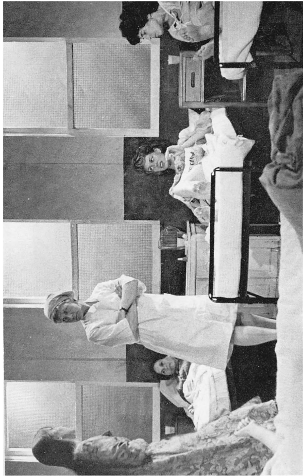
«Матушка-барыня», Интер-Арт Театр, Нью-Йорк, 1975 г.