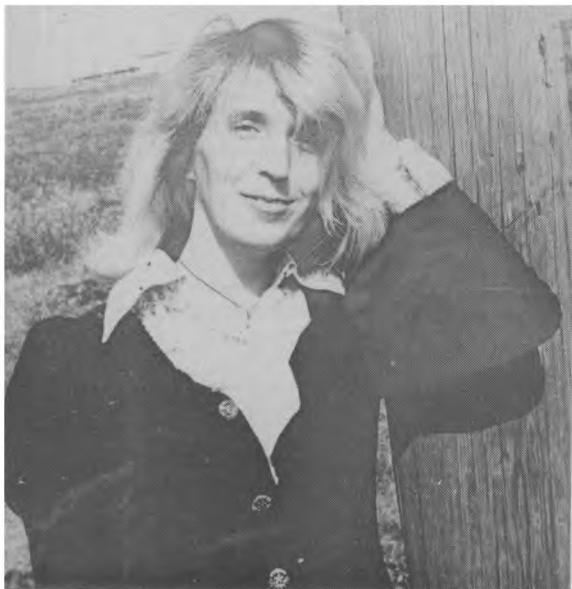
Ю. Н. Вознесенская в ссылке