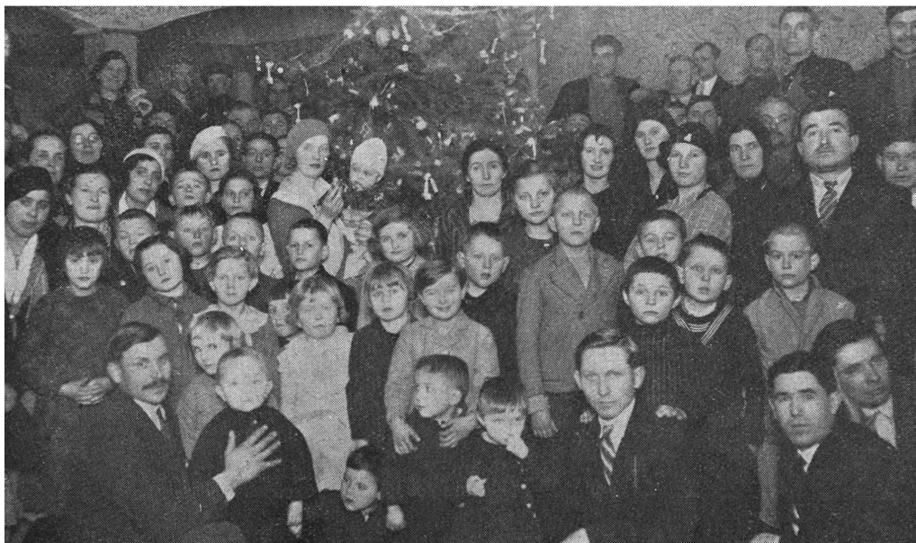
Казачья елка в Смедерево (см. предыдущий номер журнала)