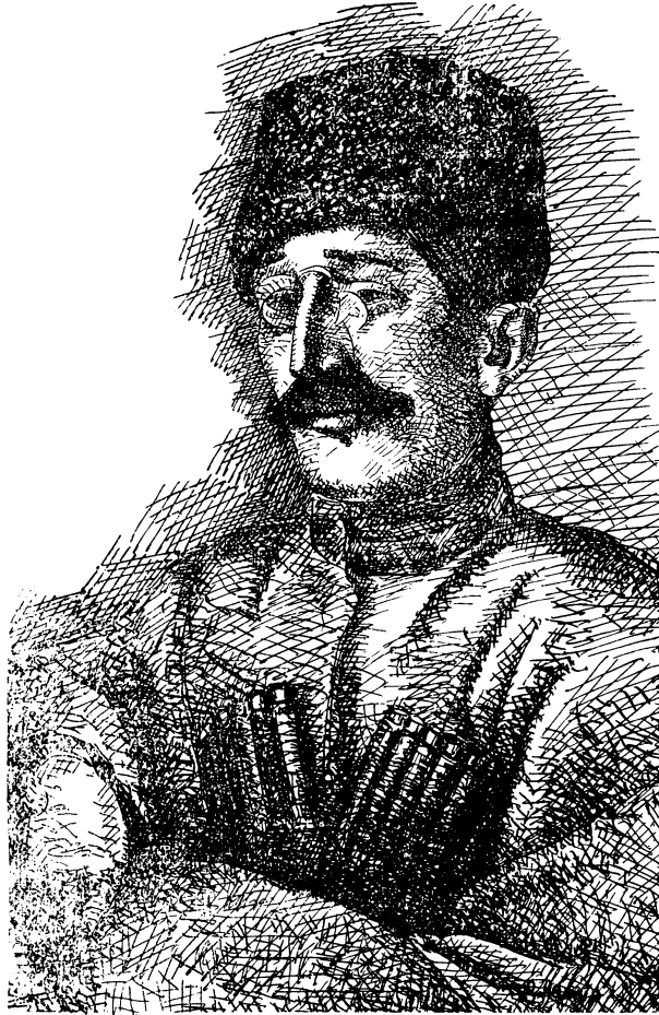
Султан Шахим Гирей.

Покойный родился в 1880 году в ауле Курго-