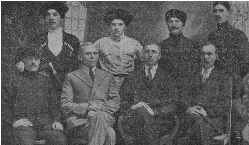
Казачи — служащие русского госпиталя в Панчево.

они попали еще с первых лет своего заграничного пребывания, где заслужили о себе хорошее имя трудолюбивых работников. Не мало казаков, благодаря их братским заботам, возвратили себе здоровье. Но и не без урона, были и такие, которым не суждено было возвратиться в свой отеческий дом, в родной Казачий край. Но и те, кто умер, имели хоть то утешение, что умерли на глазах своих собратьев-казаков, которые не сегодня завтра возвратятся на далекую свою Родину, и там может быть попадут к его семье, отцу, матери, жене и передадут от него его последнее завещание. И таких ведь у нас не мало? Сколько их умерло в этом госпитале?!