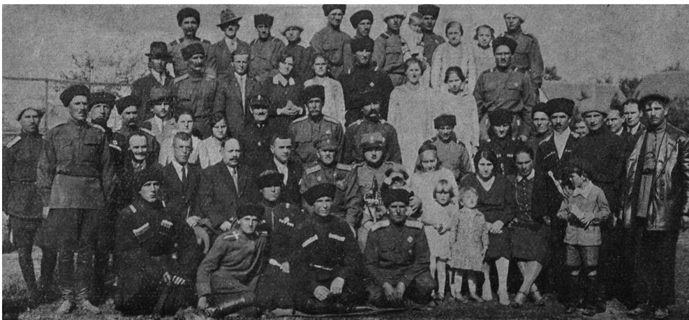
Кубанцы в Шабце.