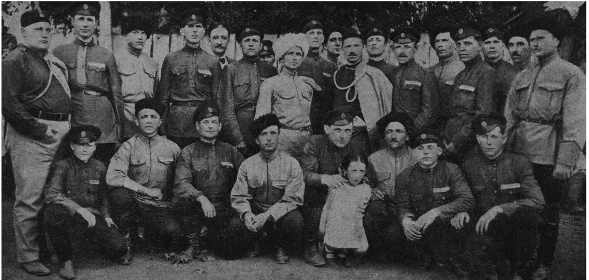
Казачи-сокола в В. Бечкереке.

Дай Бог, чтобы эти слова и эти казачьи чаяния как можно скорее претворились в реальную действительность! (Соб. кор.).