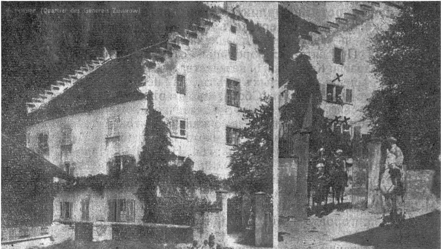
Квартира Генералисимуса Суворова въ г. Альдорфѣ (Швейцарія).

Кубанская команда джигитовъ хор. Д. А. Пянова въ составѣ 9 отличныхъ наѣздниковъ и 8 лошадей въ лѣтній сезонъ н. г. успѣшно выступала въ томъ районѣ Швейцаріи, гдѣ 129 лѣтъ назадъ проходилъ со своими чудо-богатырями легендарный Суворовъ. Въ г. Альдорфѣ джигитамъ разрѣшили размѣститься на нѣскольکو дней въ домѣ Суворова, гдѣ 26 сентября 1799 года онъ помѣщался со своимъ штабомъ, о чемъ свидѣлствуетъ имѣющаяся на домѣ надпись: „Квартира Генералисимуса Суворова“. Этому большому каменному дому насчитывается 1550 лѣтъ. При домѣ сохранились конюшни, гдѣ помѣщались штабные кони, а недалеко расположен „плацъ козакеитъ“, на которомъ лагеремъ располагалась конвойная сотня Донскихъ казаковъ. Приходилось слышать: „пріѣхали опять къ намъ казаки, но безъ