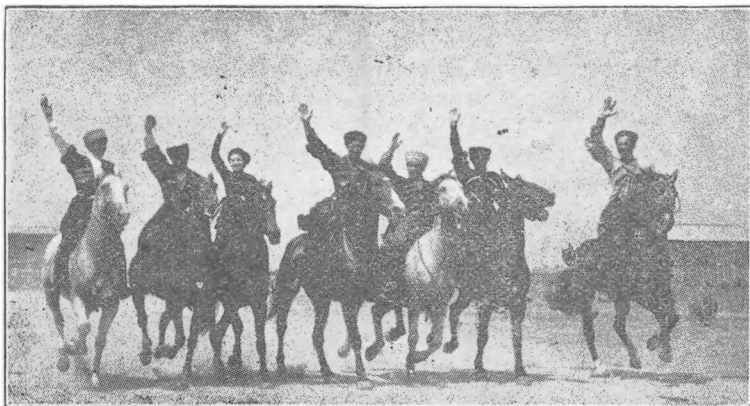
Группа джигитовъ уряд. Г. Солодухина.

Сурово встрѣтилъ нашихъ артистовъ роскошный современный Вавилонъ. Дальняя дорога съ большимъ количествомъ аварій, сго-