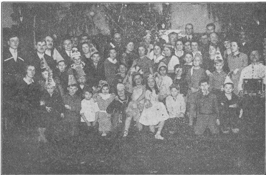
Елка 1-го Кубанскаго куреня.

Дѣтская елки состоялась 6-19 января въ той же кафанѣ и доставила собравшимся 28 дѣтямъ большое удовольствіе. Лучшіе де-