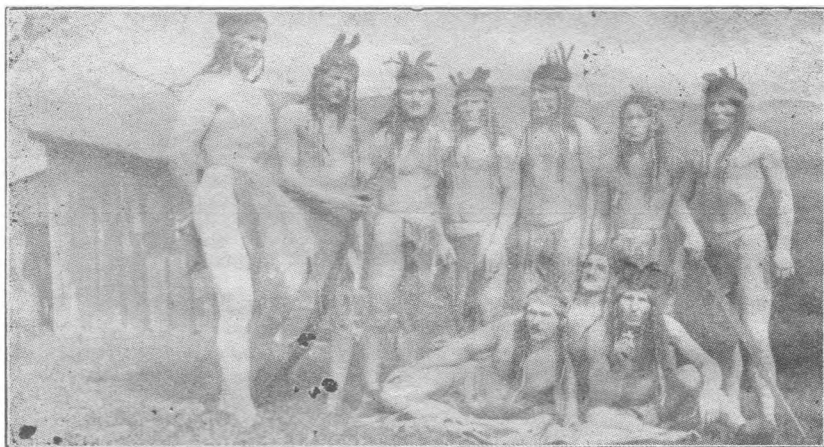
Кубанцы въ фильмѣ изображаютъ краснокожихъ индѣйцевъ.

Послѣ нѣсколькихъ джигитовокъ, поставленныхъ въ Нью-Йоркѣ и Кливландѣ, группа развалилась, т. к. постановка картины „Казакѣ“