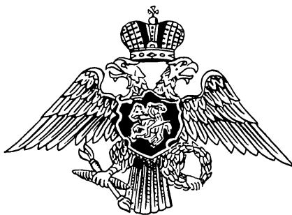
Полковой знак лейб-гвардии Литовского полка.