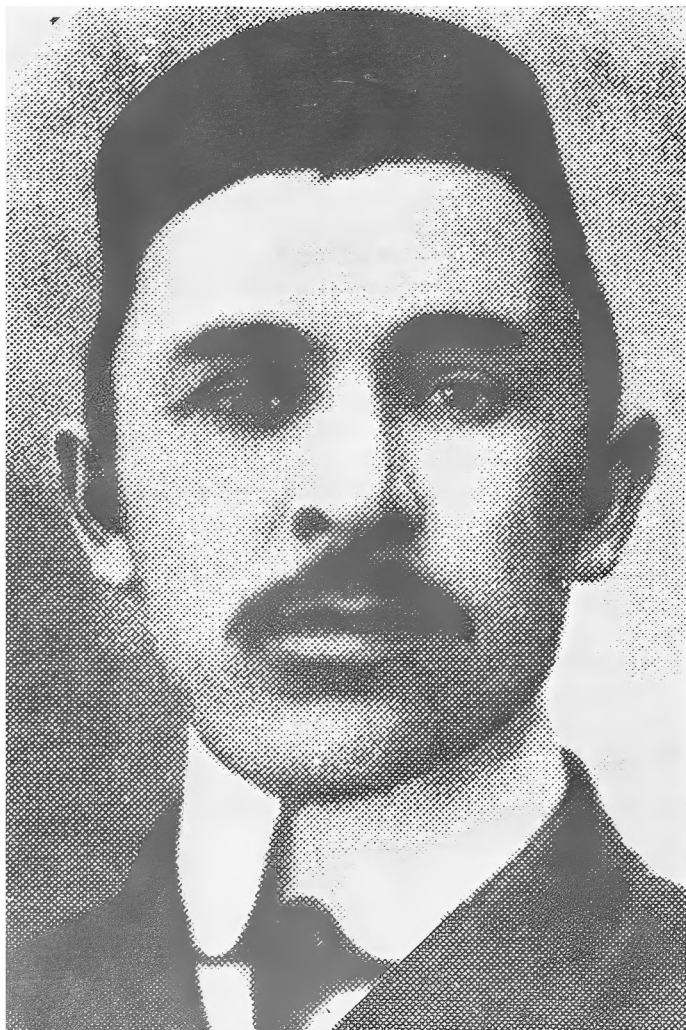
ДЖАМАЛЮТДИН ВАЛИДОВ (1887 — 1938)