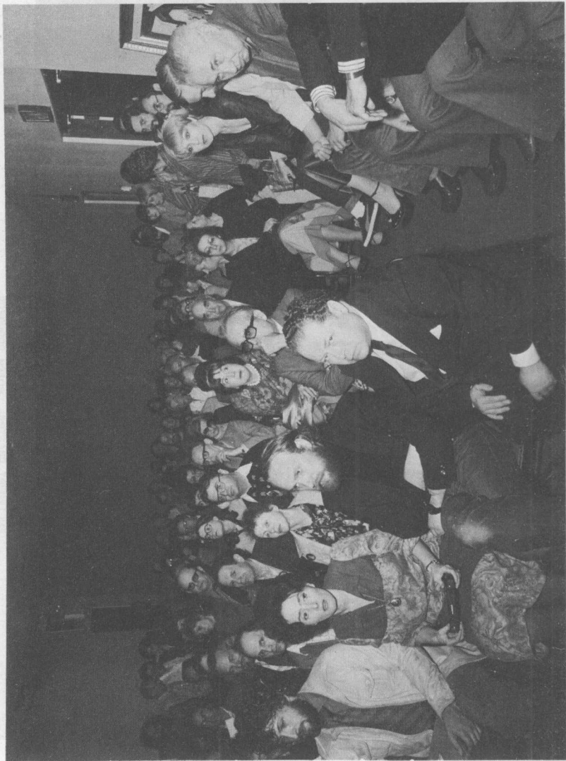
Нью-Йорк, 30 апреля 1979 года, на конференции "Третьей волны".