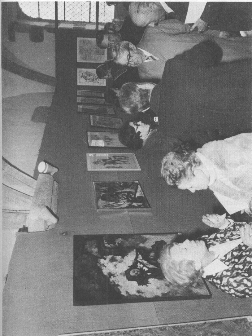
майенн, 4 мая 1979 года, вернисаж.