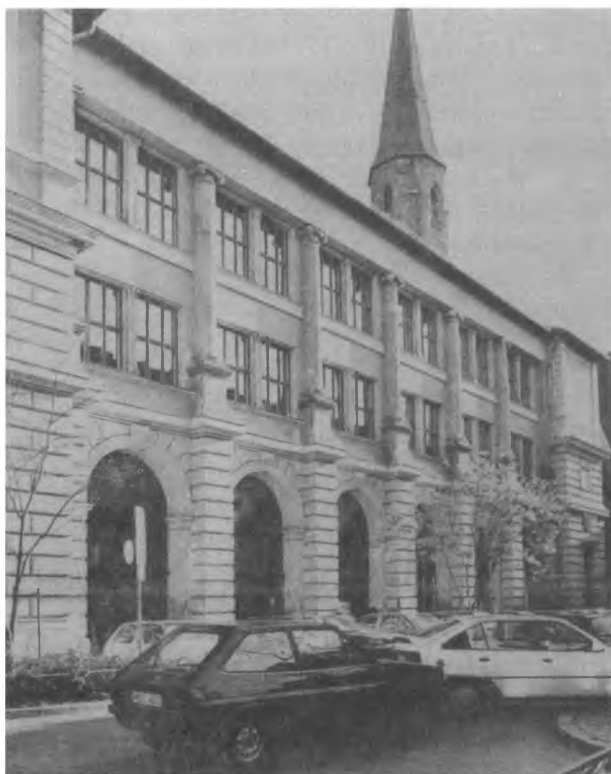
Фасад временного храма, нынешнего собора.

Как уже сказано, Свято-Николаевский приход с февраля 1946 года потерял возможность совершать богослужения в греческом храме Salvatorkirche . Планы постройки собственного храма сначала не могли осуществиться ввиду нехватки строительного материала. Храм на Denningerstraße рассматривался только как временное решение, потому что приход уже в 1942-43 гг. планировал постройку собственной церкви.