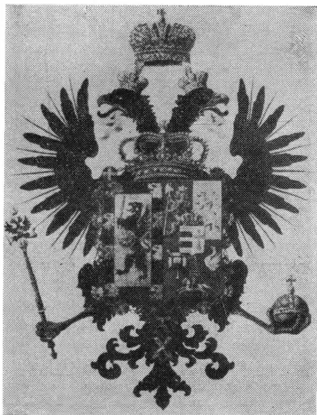
ГЕРБ РОДА РОМАНОВЫХ Высочайше утвержденный 8-ХІІ-1856 г.

Уже в начале войны 1914 года во главе армии и флота по всей ее иерархической лестнице стояли люди весьма скромного происхождения, занимавшие даже самые высокие командные посты. Нельзя не отметить, что специально образованная часть нашего офицерства, как офицеры генерального штаба, химики и техники-артиллеристы, военные инженеры, военные юристы и др. были по своей подготовке много выше гражданских лиц из высших учебных заведений не военного ведомства.