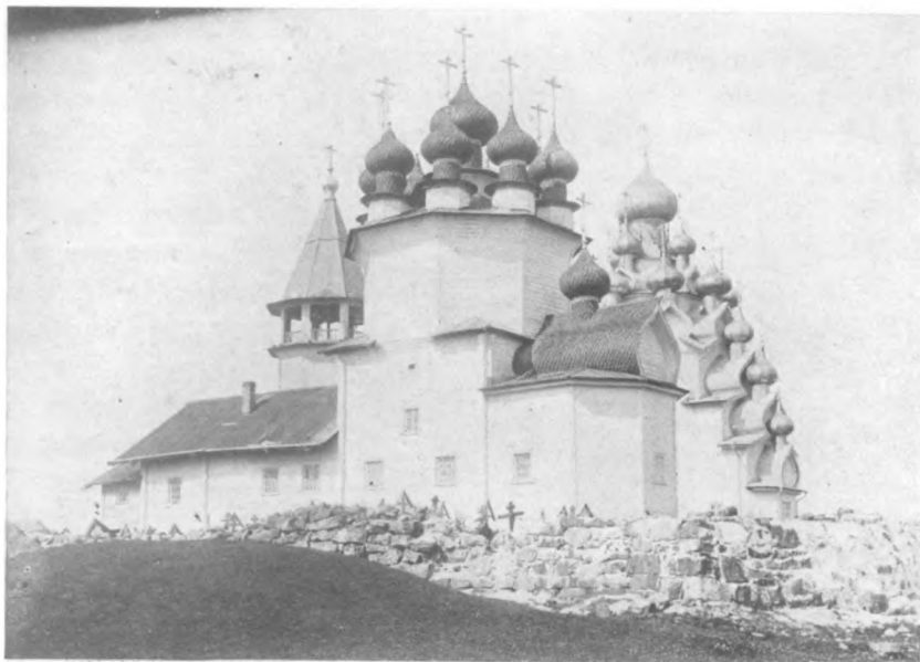
Кижи. Погостъ Олонецк. губ. Петрозаводск. у.