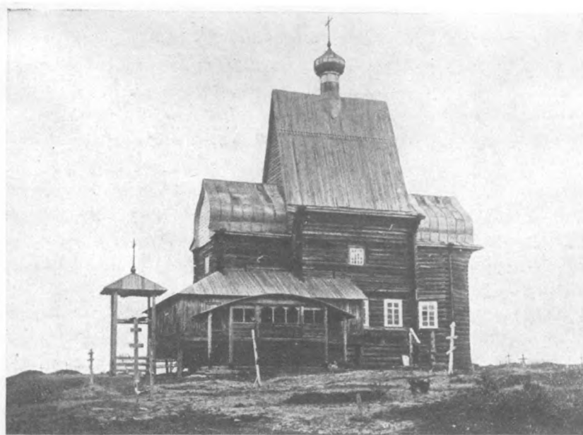
Церковь въ Усть-Паденьгѣ Шенкурск. у., Арханг. губ.