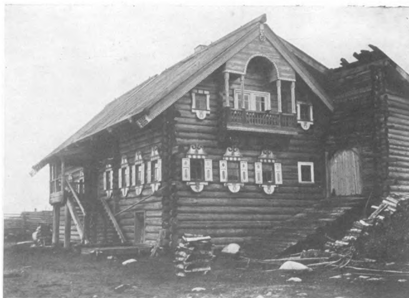
Изба Олонецк. губ.