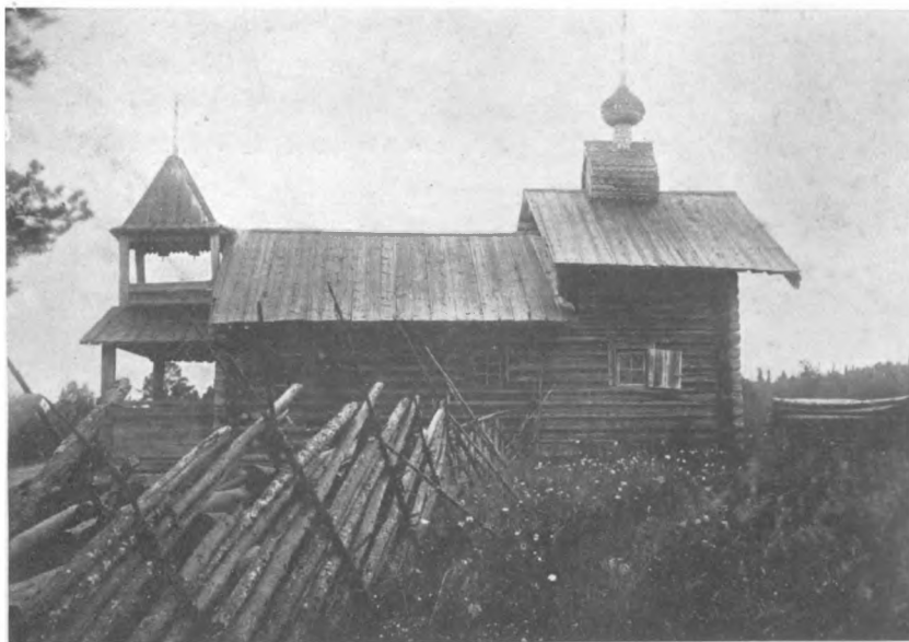
«Клѣтская» часовня въ Гапсельгѣ Повѣнецк. у. Олонецк. губ.