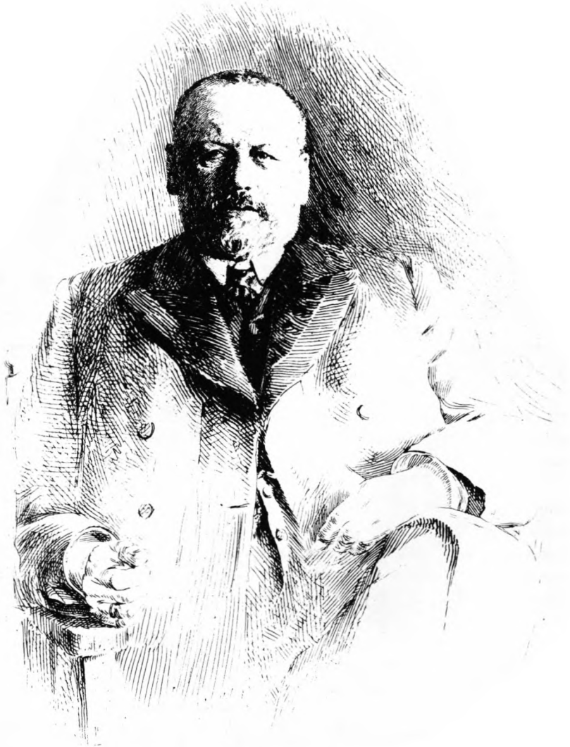
Михаил Владимирович Родзянко (гравюра)