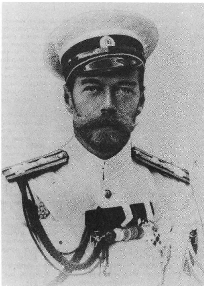
Копия той фотографии Государя Императора Николая II, которая постоянно стояла на письменном столе М.В. Родзянко до самой его смерти. После смерти М.В. стояла на столе его сына Михаила Михайловича.