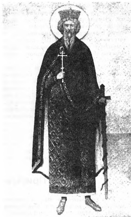
Память Владимира Святого, великого князя Киевского, Церковь празднует 28 июля. В этом церковном празднике ежегодно вспоминается свершившееся по его воле Крещение Руси, тысячелетие которого мы ныне празднуем.

Вспомним и о соборном начале, столь близком православному мышлению. Церковная соборность, создавшая понятие церковного народа, перекликалась с идеей земского строительства, а может и вдохновляла его. И когда впервые начали проявляться формы нашей русской демократии, то Освященный Собор церковный естественно стал участником Земских Соборов; оба собора были упразднены петровскими реформами. Стремление к восстановлению церковной и общественной соборности начали возрождаться в эпоху alexandrovских реформ. Созданное