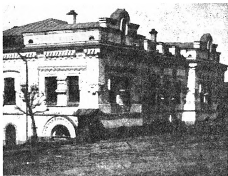
Ипатьевский дом, так называемый "дом особого назначения", в котором 17 июля 1918 года была убита царская семья: Николай II, его жена Александра Федоровна, наследник Алексей, дочери Ольга, Татьяна, Мария, Анастасия.

Бессмысленно предсказывать формы российской свободы. Придет ли она, как мечтал и строил великий Столыпин, под скипетром законного, избранного землей и помазанного Церковью монарха? Или будет существовать в республиканских формах? Не знаю, это решит народ.