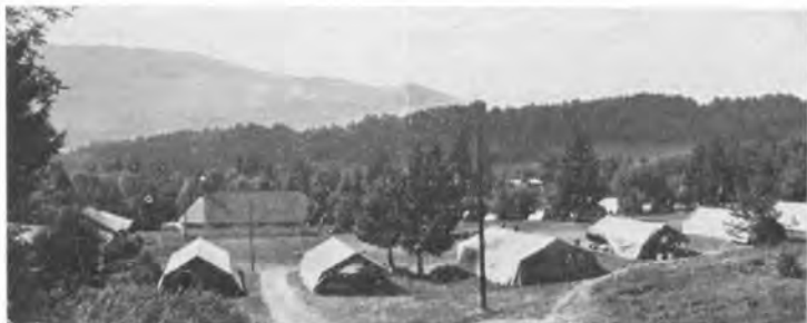
Общий вид лагеря

Основан в 1934 г. в местечке «Лафрей» в департаменте Изер, во французских Альпах и посвящен памяти великого русского полководца Суворова