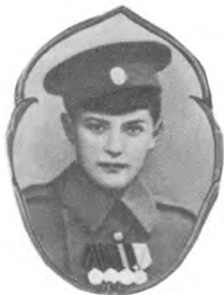
Е.И.В. Наследник Цесаревич Алексей Николаевич