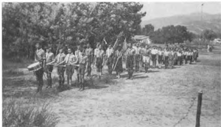
Парад в Алексеевском лагере (1935 г.)

Основан в 1929 г. в местечке « Напуль » на Средиземном море и посвящен памяти убиенного Наследника Цесаревича Алексея Николаевича