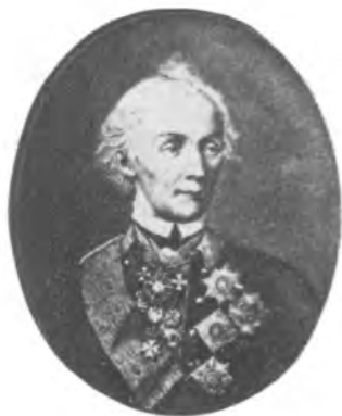
1730-1800 Генералиссимус Князь Александр Васильевич Италийский Граф Суворов Рымникский