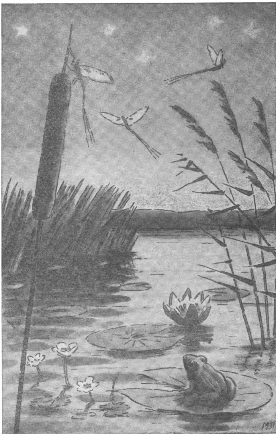
Наконец-то прибыли главные гости — Эфемериды.