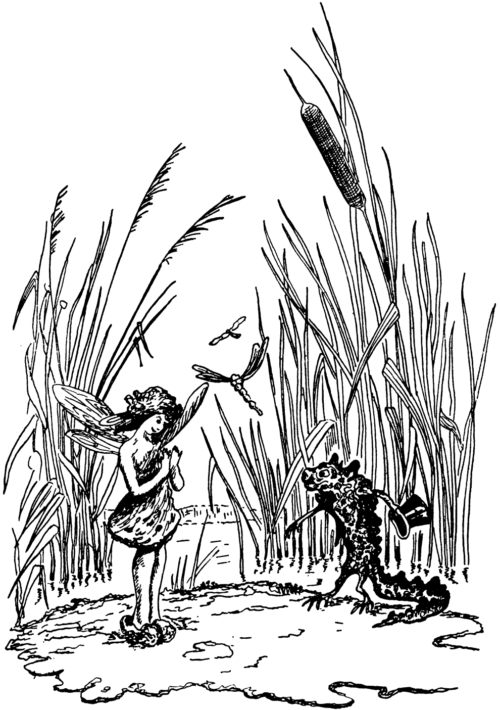
Какой праздничный и счастливый вынырнул тритон из воды и побежал по берегу навстречу Вобюль.