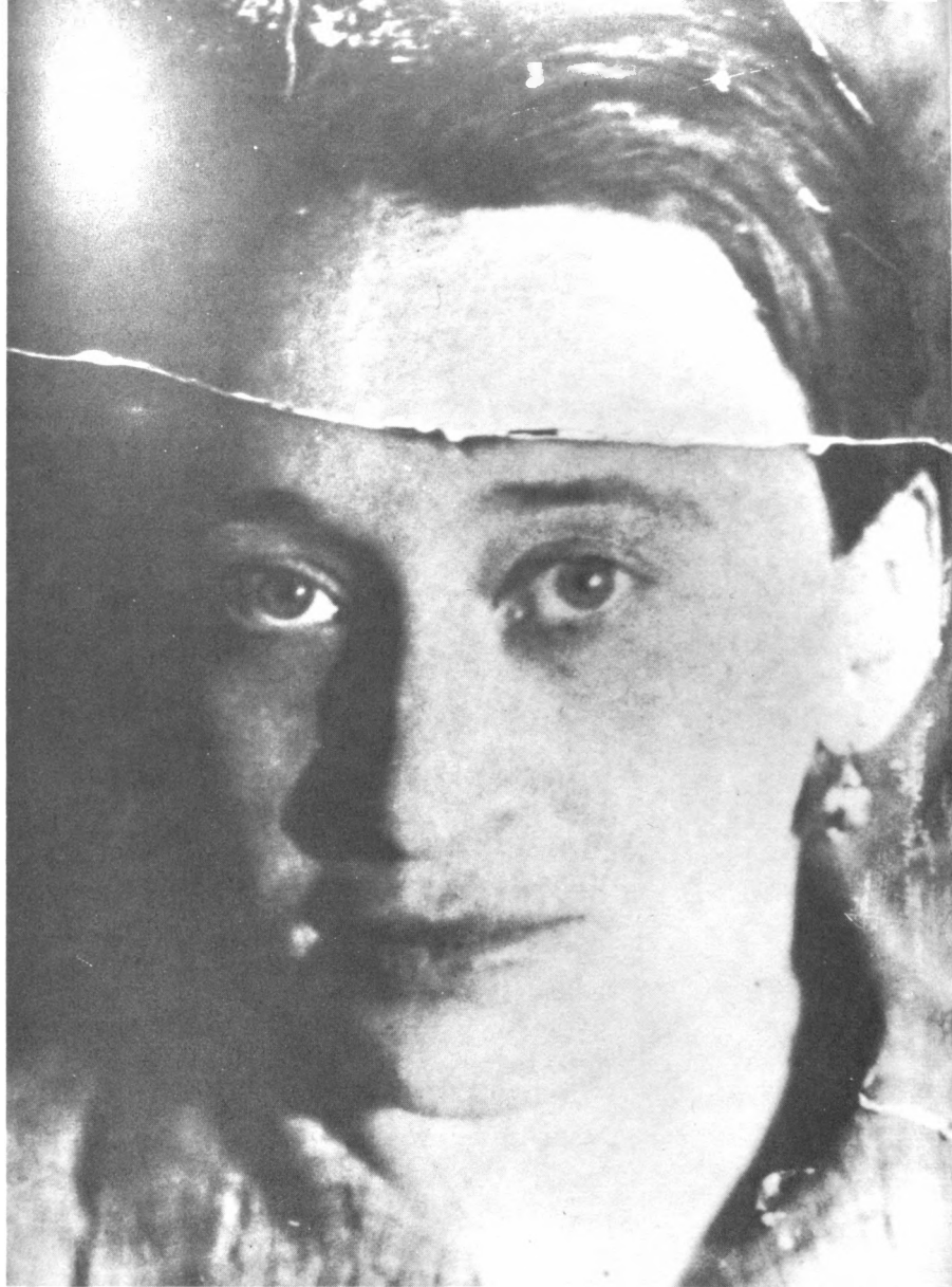
Н. Я. Мандельштам