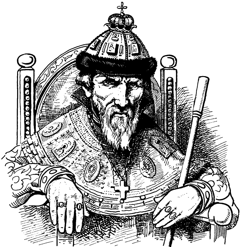
Царь Іоаннъ IV Васильевичъ.