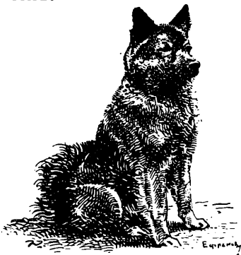
Восяй пріоткрылъ глаза.

Слѣпымъ щенкомъ изъ далекой Сибири, изъ-за Каменнаго пояса — Уральскихъ горъ — привезли мѣховщики вогулы Ѳедѣ эту забавную игрушку. Ѳедя поилъ его молокомъ съ пальца и было нѣжно обжатіе маленькаго чернаго рта и щекоталь Ѳединъ палець крошечный розовый язычекъ.