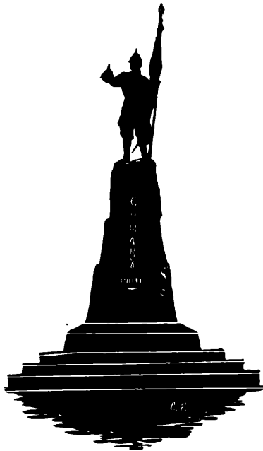
Памятникъ Ермаку въ Новочеркасскѣ.

Въ блѣдномъ разсвѣтѣ стала видна вся рѣка. Ѳедя, стоя, правилъ весломъ и вглядывался въ волны. Ему показалось, что онъ увидалъ темное пятно... Это былъ Восяй. Онъ плыль