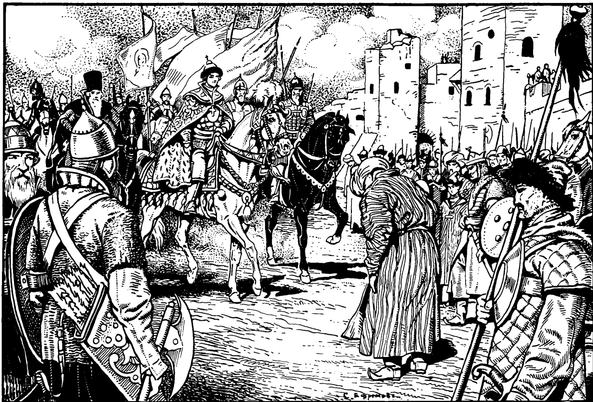
Къ дому царя Казанскаго медленно ѡхаль царь Иоаннь Васильевичъ (къ стр. 39).