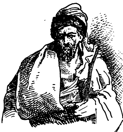
Едва-ли не прокаженный.

Ермакъ подошелъ къ столу, раскинулъ чертежъ, пододвинулъ ставцы со свѣчами и долго разсматривалъ, изучая,