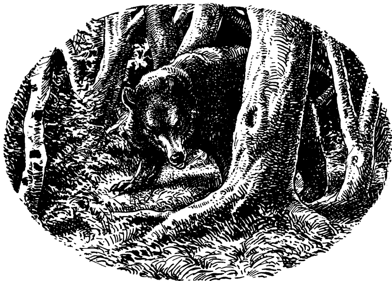
Медвѣдь вышелъ изъ чащи.

Была ночь. Которая по счету въ лѣсу — Одея не помнилъ. Третья, или четвертая. Онъ быстро слабѣль и теперь долго и крѣпко спалъ, не обращая вниманїя на лѣсные шумы.