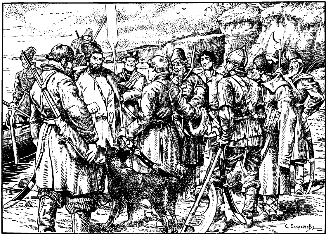
Казаци окружили Федю (къ стр. 92).