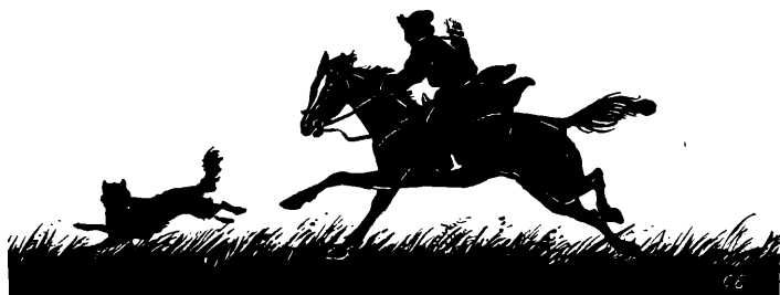
Восяй поспѣвалъ за Ѳедей.

Вѣроятно татарскія собаки разспрашивали Восяя. Что имъ плелъ про себя и про Ѳедю Восяй — неизвѣстно, но, должно быть, плелъ что-нибудь забавное, потому что собаки кругомъ обступили его и сидѣли и лежали, глядя внимательно на пришельца.