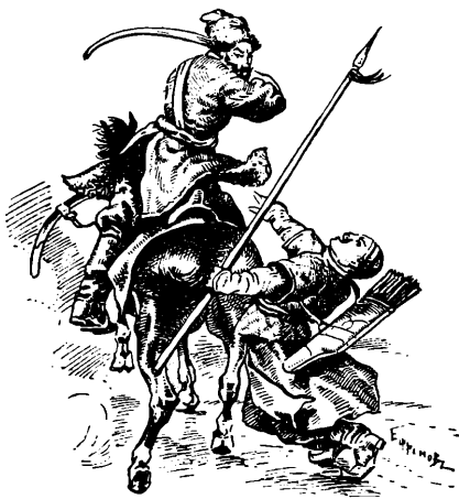
Сильная рука заносила ударъ.

Ермакъ пощадилъ плѣн- ныхъ, далъ имъ свободу и об- ласкалъ ихъ. Онъ зналъ, какъ и чѣмъ купить сердца азіатовъ и какъ малыми силами завое- вать Сибирь.