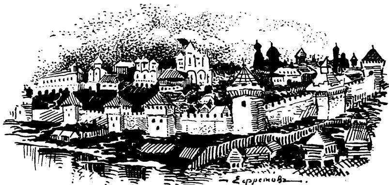
Юаннова Москва бѣлокаменная.