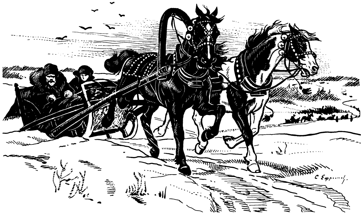
Пара съ пристяжкой покойно бѣжала спороу рысью (стр. 59).