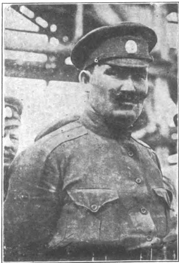
Атаманъ Г. М. Семеновъ, въ началѣ поднятаго имъ противобольшевистскаго возстанія. на Дальнемъ Востокѣ.