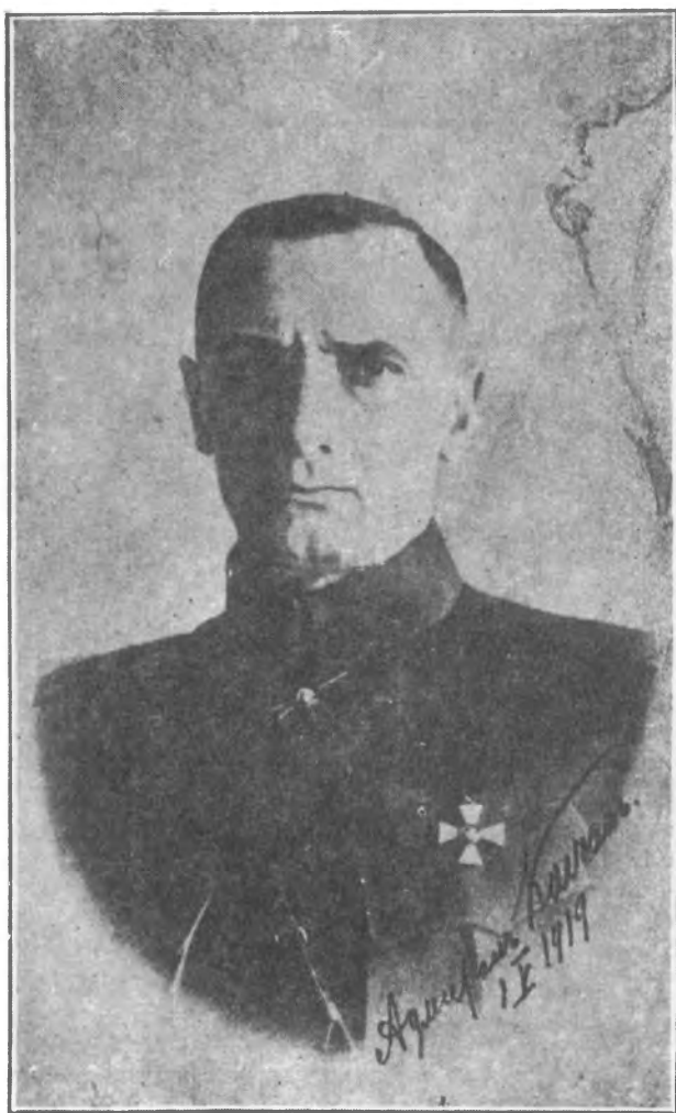
Верховный Правитель, Адмиралъ А. В. Колчакъ.