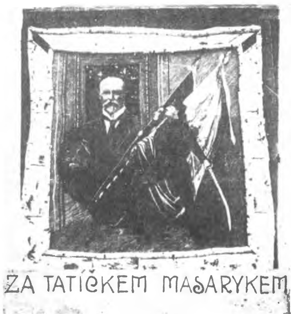
Портретъ Президента Ч.С.Р., Т. Г. Масарика, на одной изъ легіонерскихъ теплушекъ.