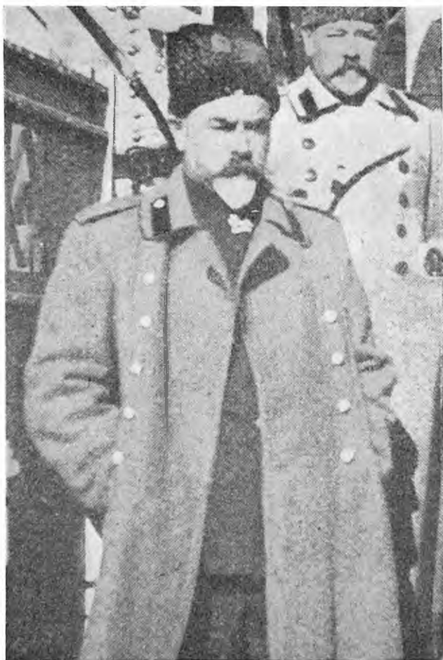
Ген. А. І. Денікін і ген. Лукомський (Фото до стор. 95)