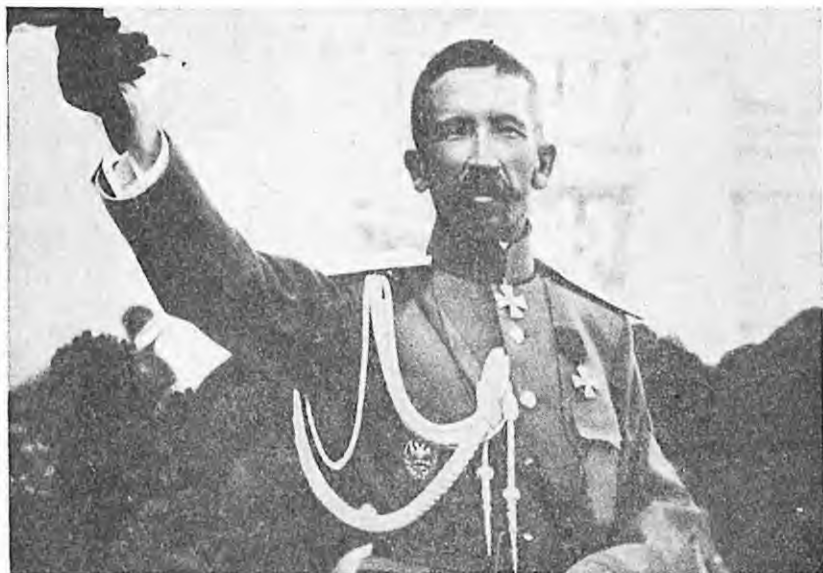
Л. Корнілов — генерал від інфантерії й організатор військової Добровольчої армії, її перший головнокомандувач.

Корнілов сідав на прекрасну булану кобилицю, боком ристю оминав всю армію і в голові авангарду спішувався і йшов далі пішки. Початок такого маршу супроводився співом: „так за Корнілова, за родину за славу“. Цей спів майже не вгавав, коли не було боїв. До ст. Хомутовської щось близько 18 км., але по страшному болоті армія ледве рухалася, відриваючи болото. Найтяжче було з гарматами, що вимагали частих зупинок і зчищення багна з коліс. На половині дороги коні пристали. Довелось підпрягати ще по четверикові, лишаючи на якусь годину по гарматі й з набоями скрині, забираючи їх другою турою. При такому способі руху армія доплелася до Хомутовської станиці, коли вже почало темніти. Командарм всю армію пропустив повз себе і останнім зайшов у станицю. Цей порядок дотримувався точно протягом цілого походу.