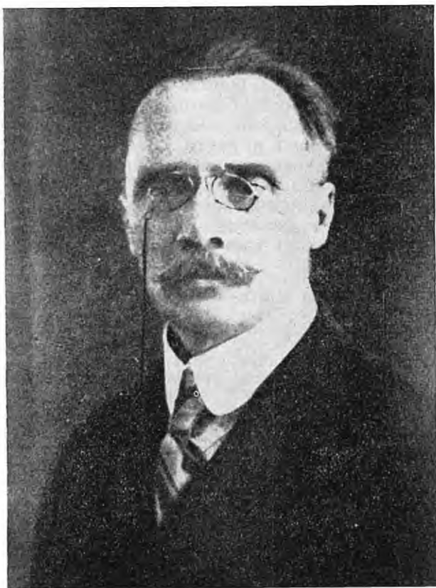
Л. Бич — перший прем'єр, політичний дороговказник Кубані

буде вести важче, тому, що ви будете зруйновані й дезорганізовані. Коли вам стане дуже важко, коли ви будете примушені взятися за зброю, ви повинні пам'ятати, що ми існуємо, що ми з нашим відділом дамо вам допомогу.