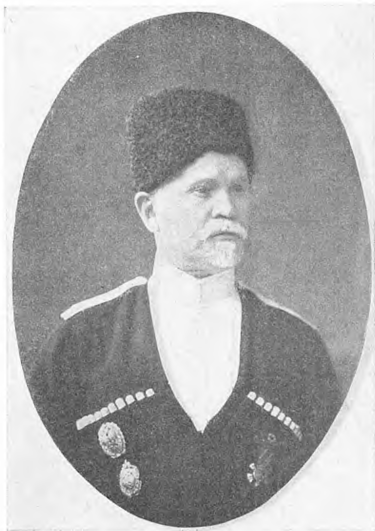
Генерал-лейтенант О. Філімонов — отаман Кубані

Останній — військовий юрист, працював на адміністративних посадах, не нюхаючи пороху. Революція застала його на посаді отамана Лабінського Відділу. Полк. Філімонов був дуже спритний інтриган, без обтяження будь-якими моральними мотивами, ніби росій-