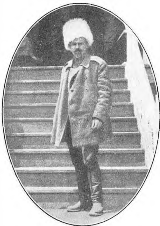
Генерал Марков — найактивніший генерал Добрармії.

Охорона, очевидно, була виставлена, але ні дивізійники з 39, ні інші не наближались. Ставка розташувалася в ст. Мечотинській. Туди ж переїхав Кубанський Уряд, Законодавча Рада з їхнім апаратом. В Єгорлицькій правив ген. Марков—висококультурна людина, але й великий неділимець. Козаки його любили за військову відвагу й привітність та приступність. Він був лектором історії в Академії генштабу, був педагогом, начитаним і психологом. Він відразу орієнтувався, про що з ним можна говорити. В. М. під час спокійних переходів з ним їхав поруч і про різне розмовляв.