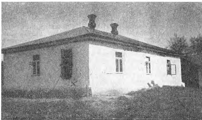
„Фарма“ (X кімната ген. Корнілова)

Тихорецька—Катеринодар, а залишила частину „садів“ на сході міста. Полк Нежінців водив своїх корніловців багаторазово в атаку й різні обходи, поніс великі втрати, а нарешті й сам поліг цього дня. Це була знову тяжка й велегко заміняма втрата. Шанси на перемогу з години на годину маліли. Вояки знесилювалися, але віра у Корнілова не послабла. Вся надія була на нього. Тому,