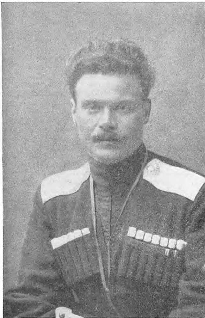
Ген.-лейт. А. Шкуро — партизан Кубаницьки

приблизив після реорганізації й постачання йому гармат і технічних частин, розвернути в дивізію. зберігаючи за ним командування“.