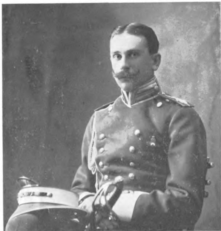
Князь П. П. Ишеев В 1908 году.