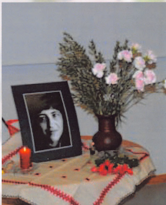
Памяти поэта Ольги Бешенковской