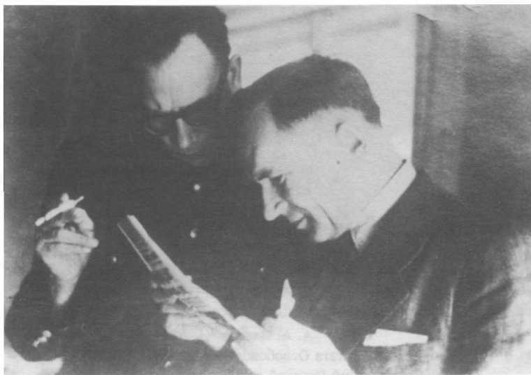
Слева направо: генерал-лейтенант А. А. Власов и генерал-майор Василий Федорович Малышкин.