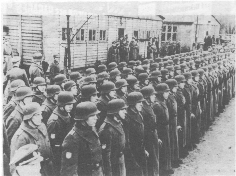
Дабендорф, 1944. Русские курсанты.