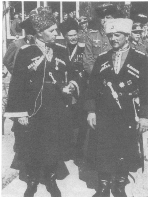
15-й Казачий кавалерийский корпус Слева направо: генерал-лейтенант фон Паннвиц, генерал А. Г. Шкуро, полковник фон Шульц, казачий штабной офицер.