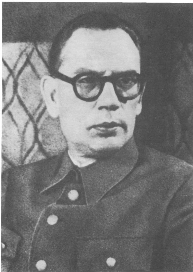
А. А. Власов председатель Комитета Освобождения Народов России, главнокомандующий Русской освободительной армией.