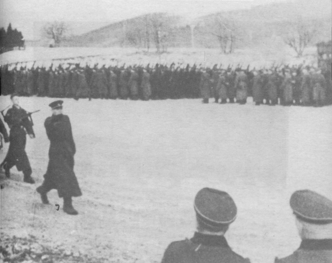
Мюнзинген, 10 февраля 1945 г. Парад при принятии Власовым главнокомандования.