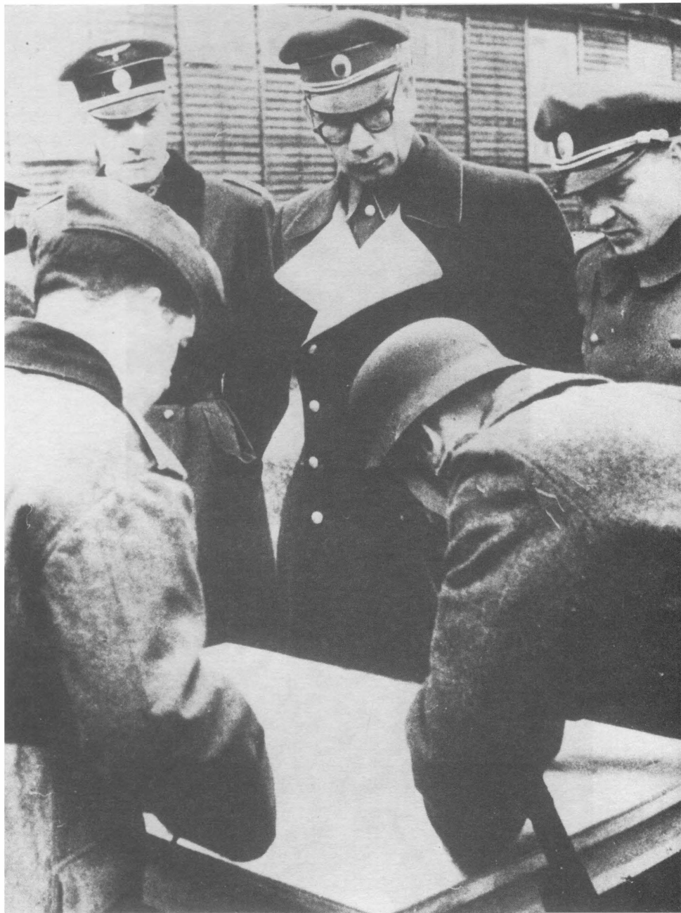
Дабендорф, 1944. Генерал-майор Ф. И. Трухин и генерал-лейтенант А. А. Власов.