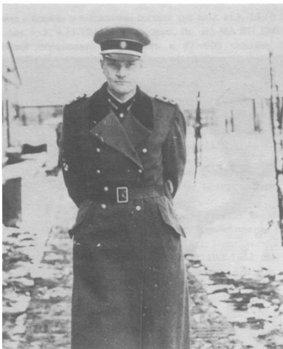
Генерал-майор Федор Иванович Трухин.