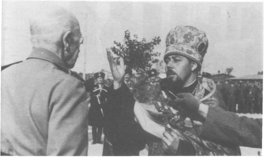
15-й Казачий кавалерийский корпус Генерал П. Н. Краснов, священник.