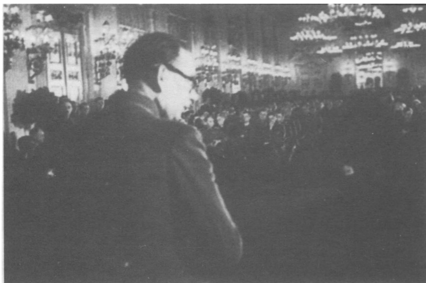
Пражский Бург, 14 ноября 1944 г. Генерал-лейтенант А. А. Власов зачитывает манифест КОНР.