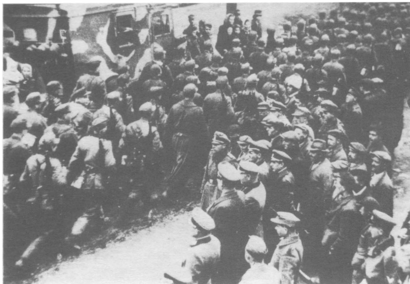
Бероун, 4 мая 1945 г. 1-я дивизия на марше.