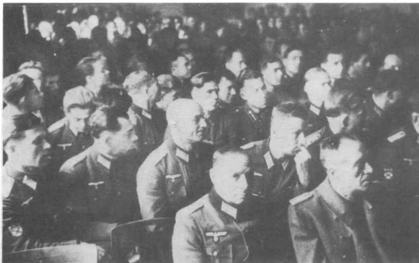
Дабендорф, 1944. Русские офицеры.