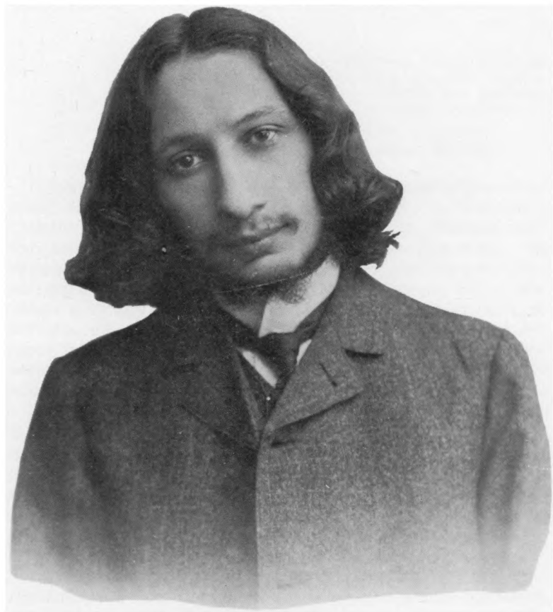
Павел Александрович Флоренский 1882 — 1943 (Фотография 1909 г.)