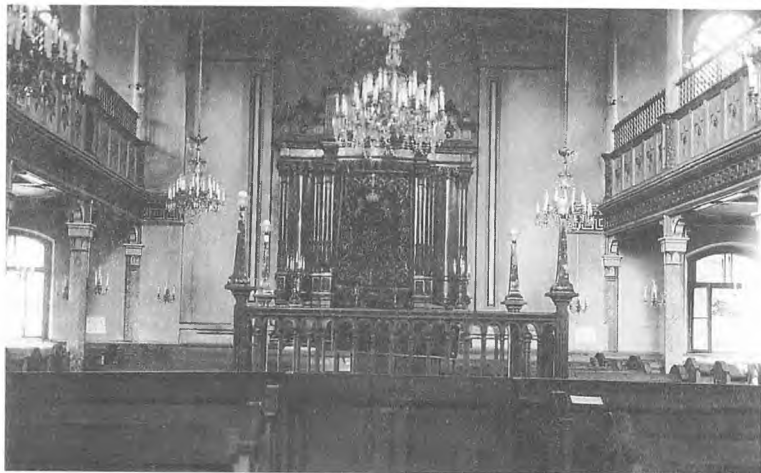
Хоральная синагога Лиепая.

На этой тяжелой работе рядом оказались портные и врачи, сапожники и адвокаты, для фашистов все они