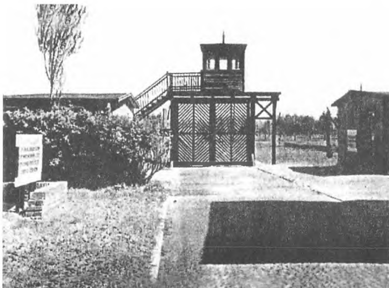
Главные ворота концентрационного лагеря «Штутхоф»

В августе-сентябре 1944 года в «Штутхофе» насчитывалось 50-60 тысяч заключенных. Все они разделялись на категории по роду совершенных преступлений и носили на груди и на штанине треугольники соответствующего цвета.