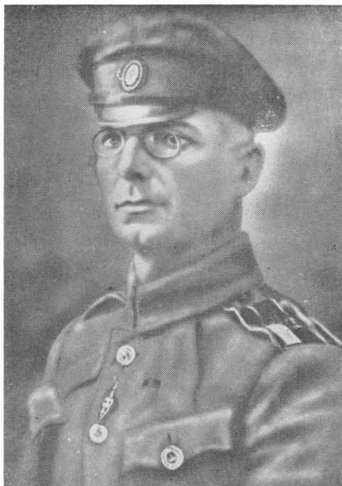
Ген. шт. ген.-майор М.Г. Дроздовский Род. 20 октября 1881 г. † 14 января 1919 г.