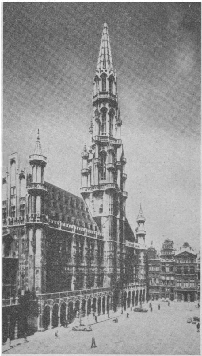
Брюссель — столица Бельгии. La Grand' Place — Большая Площадь.