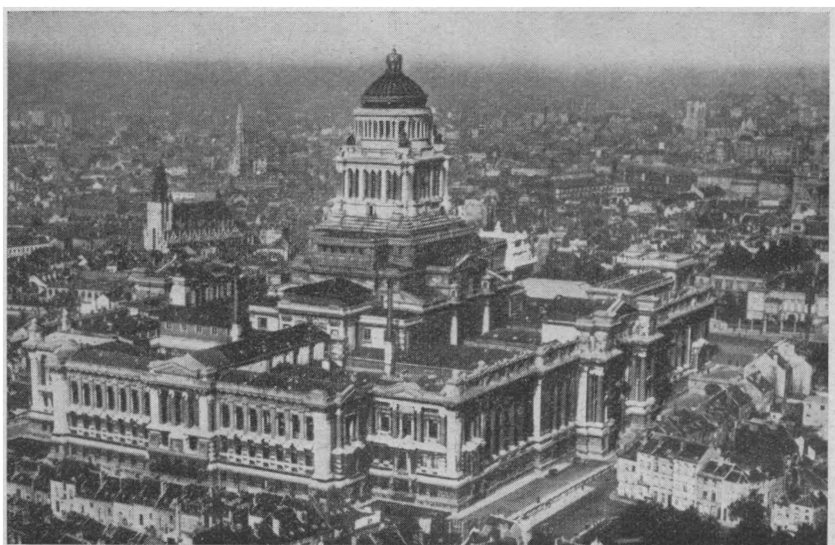
Брюссель. Вид с воздуха на Дворец Юстиции.