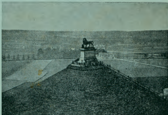
Ватерлоо. Памятник победы над Наполеоном.

Издание Центрального Объединения Политических Эмигрантов из СССР (ЦОПЭ)