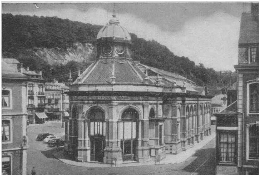
Спа, — минеральные источники. Источник имени русского императора Петра Великого.