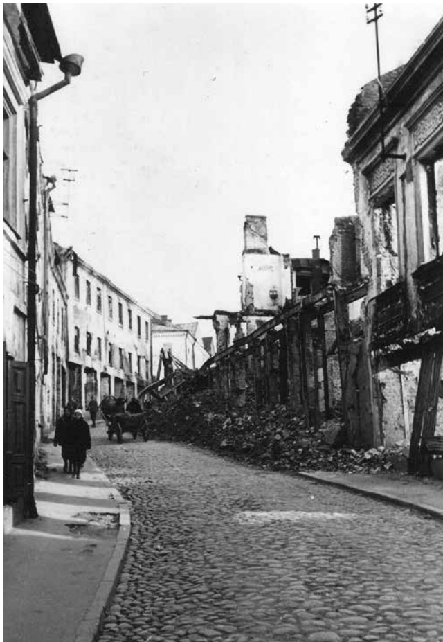
55. Вуліца Дзям'яна Беднага пасля 2 верасня 1942 году. У верхняй частцы вуліцы ўжо відаць сьляды нямецкіх расчыстак, а, магчыма, і савецкіх бамбаваньняў. Паколькі забудова Замчышча была спаленая і часткова разбураная якраз у выніку савецкіх бамбаваньняў 1942 году, то нейкая бомба магла трапіць і ў верхнюю частку вуліцы Дзям'яна Беднага. Датуецца паводле параўнаньня з аэрафотаздымкам Люфтвафэ 2.09.1942.