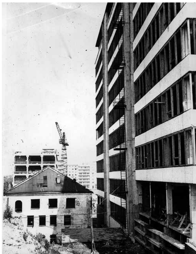
169. Пабудова інстытуту «Белпрампраект» у непасрэднай блізкасці Халоднай сынагогі на Школьным двары. Зразумела, што старое павінна было саступіць новаму, што і здарыцца праз тры гады. Здымак 1968 году. Інстытут здадуць налета.