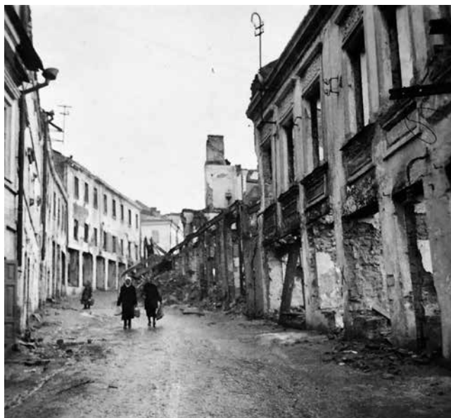
56. Вуліца Дзям'яна Беднага пасля 2 верасня 1942 году ў сваёй верхняй частцы.