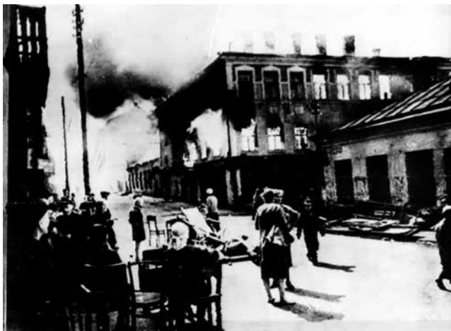
A48-NY-7-7-44-RADIOPHOTO FROM INP SOUNDPHOTO...U.S.S.R..SITTING ON SIDEWALKS WITH THEIR BELONGINGS, RESIDENTS OF LIBERATED CITY OF MINSK LOOK AT THEIR HOMES, BURNED BY NAZIS BEFORE THEY WERE DRIVEN OUT OF CITY.....PULL SERVICE.....