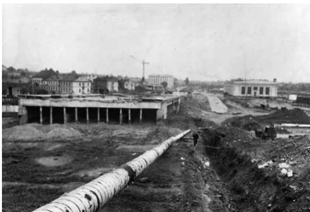
165. Вуліца Завальная ў бок Замкавай. Канец 1950-х гадоў.

166. 1959 год. Дом спорту «Трудовые резервы» на Замчышы з басэйнам у глыбокім цокальным памяшканьні ўжо пабудаваны. Пачалося будаўніцтва так званага «путепровода» для будучай Паркавай магістралі.