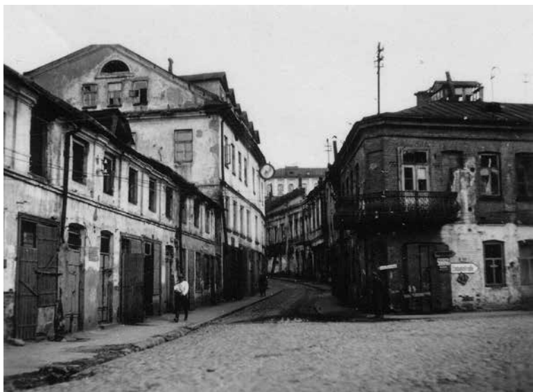
58. Вулиця Дзям'яна Беднага зімой 1943–1944 гадоў.