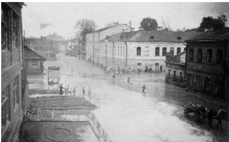
30. Вуліца Няміская летам 1942 году.

31. Паводка пасья навалніцы на стыку вуліц Няміскай і Рэспубліканскай летам 1942 году. Лявей уверсе траса Няміскай заварочвае направа, а над ёй пануе дах былой Кацярынінскай царквы з ацалелай правай вежай бяз купала. Пад вадой схаваны даволі якасны брук гэтага скрыжаванья з глыбокімі рышкамі.