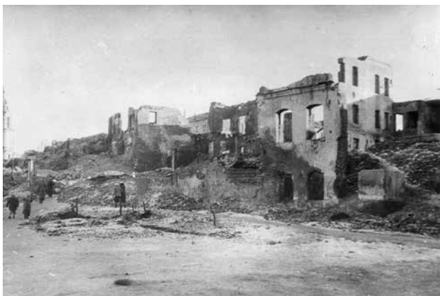
144. Руіны паміж вуліцай Калініна і Плошчай Свабоды ў раёне былога Школьнага двара, далей уверх ад яго. Людзі паварочваюць направа, на Вольную, каб падняцца на Плошчу Свабоды. Зьлева відаць адну з вежаў касьцёлу жаночага бэрнардынскага кляштара, сёньня праваслаўную катэдру. Справа відаць старажытныя скляпеньні цокальнага паверху адной са старых камяніцаў, якія апявалі Шчакаціхін і Касьпяровіч. Зіма 1945–1946 гадоў.