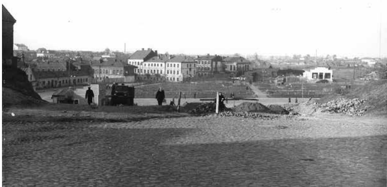
154. Упарадкаваньне новай шырокай вуліцы Вольнай. На месцы кварталаў паміж былымі Рыбным і Нізкім рынкамі ўжо пасаджаны сквэр. У наступным годзе да дрэваў дададуць кусты. 1950 год.