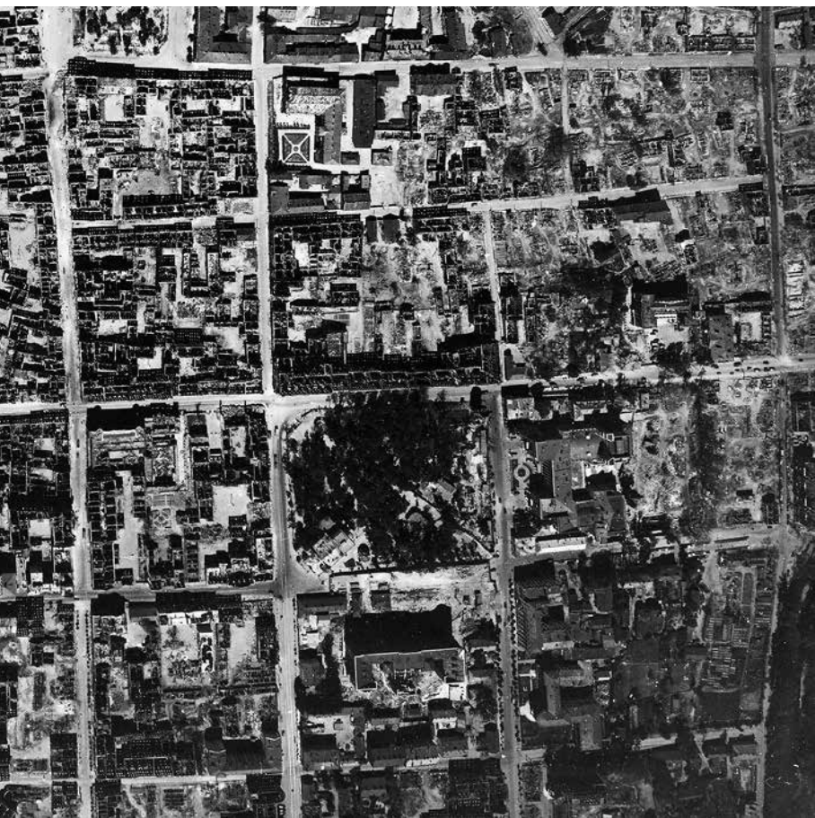
12. Спаленая пажарамі першых дзён вайны забудова Новага гораду і кварталаў паміж вуліцамі Інтэрнацыянальнай, Савецкай, Карла Маркса і Кірава. Ліпень 1941 году.