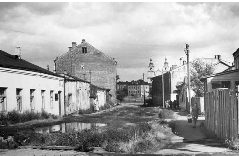
163. Вуліца Нова-Мясьніцкая ў бок Замкавай. Канец 1950-х гадоў.