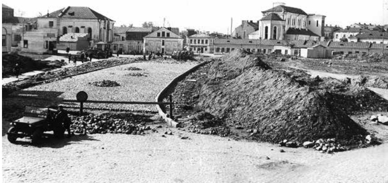
153. Брукаваньне новай шырокай вуліцы Калініна, якую працягнуць да моста празь Сьвіслач. 1949 год. Сам Нізкі рынак, які знаходзіцца за сьпінай фатографа, яшчэ доўга ня будучь чапаць.