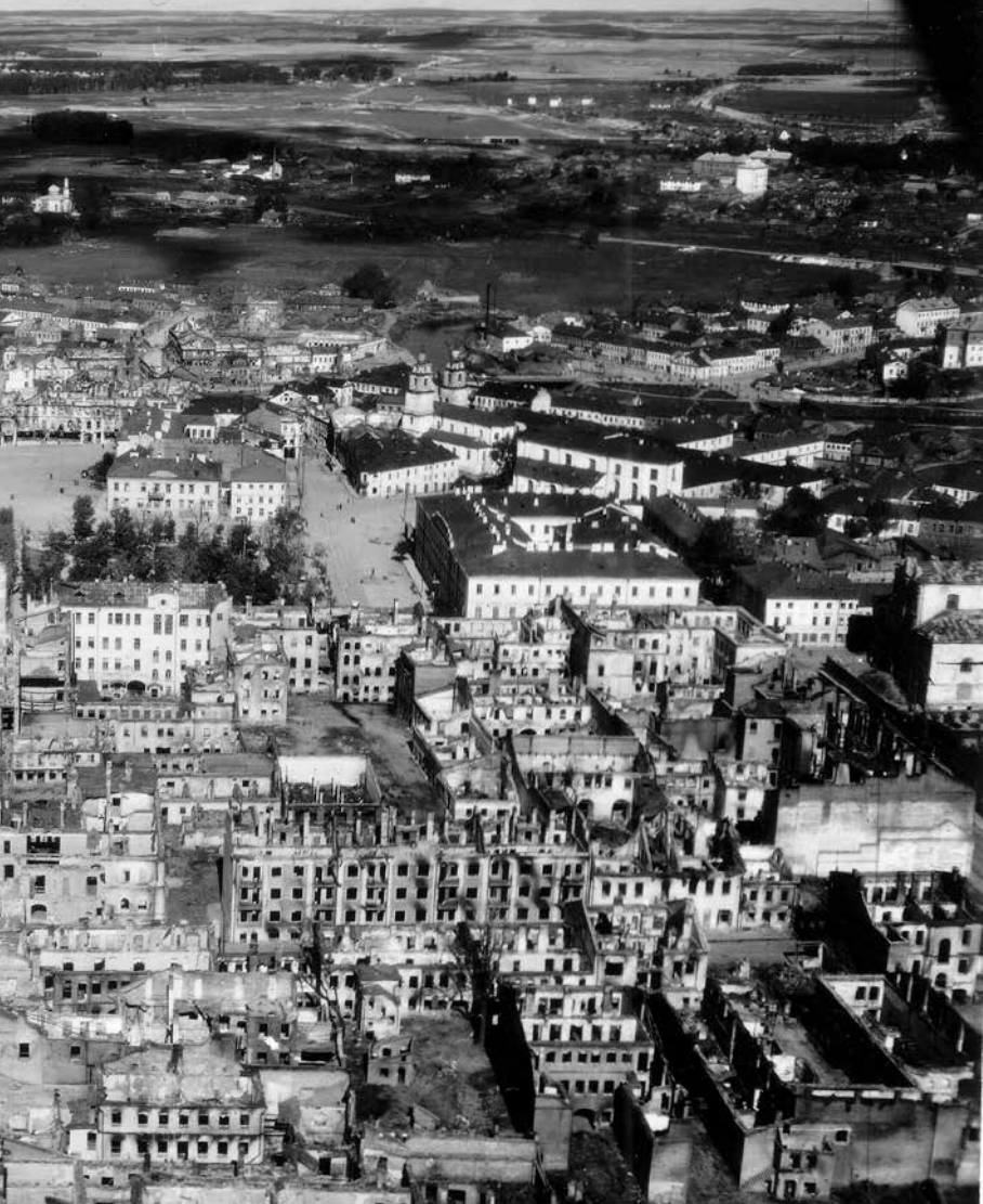
13. Панарама гістарычнага цэнтру Менску з паўднёвага ўсходу. Восень 1941 году. Здымак з так званай калекцыі Ганса Руфа ў музэі Вялікай Айчыннай вайны. Некалькі дзясяткаў авіяздымкаў 1941 году з гэтай калекцыі, зробленых з малой вышыні, застаюцца найлепшымі гістарычнымі фотадакумэнтамі па гісторыі старой архітэктуры Менску.