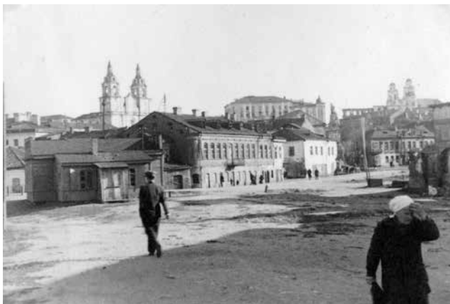
65. Від з паўночнага кута Нізкага рынку. Меркавана 1943 год. Фронт забудовы самага старога кварталу паміж вуліцамі Дзям'яна Беднага і Вольнай на Плошчы Свабоды ўжо падарваны, ад яго відаць толькі ўнутраная сьцяна аднаго з дамоў характэрнай формы з чатырма аконнымі праёмамі.