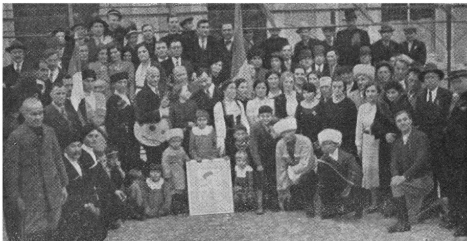
ВК Округ в Югославии празднует 10-е декабря.