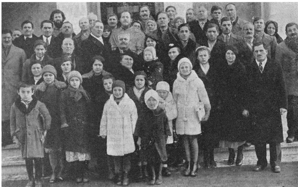
Бухарестская ВК станица в день праздника 10-го декабря.