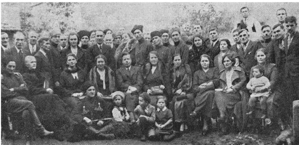
Походный Атаман в дружной семье вольных казаков и украинцев в Ромба.