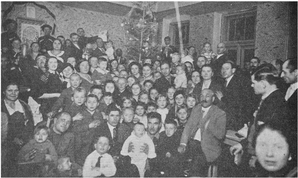
Елка для казачат в Смедеревской ВК станице 8 января с. г.

ветственный импр. А. Павлов». Посередине афиши — фотография, на которой видны 15 человек, в черкесах и кубанских папахах.