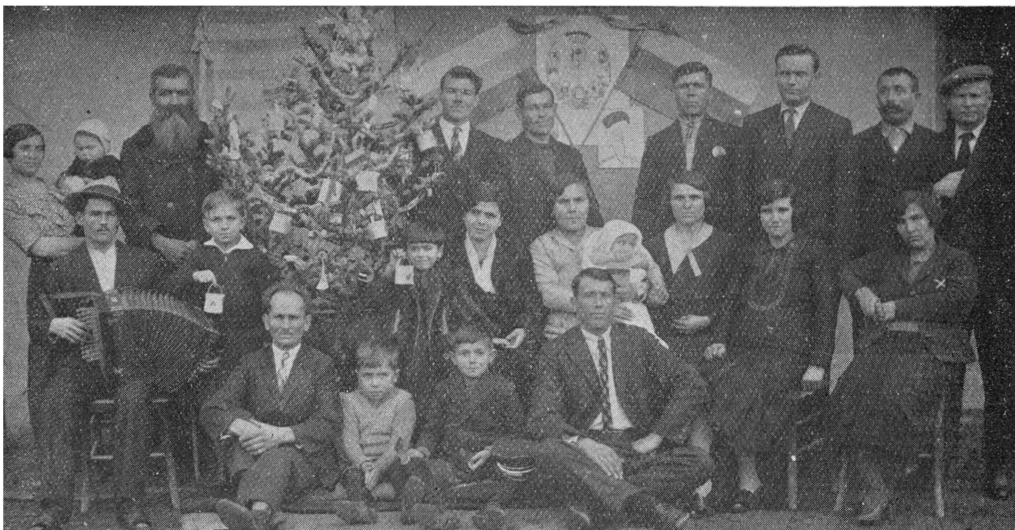
Казачья елка для детей Лесковецкого ВК имени атамана Ермака хутора

ятное предано забвению. Незаметно пролетело время до 2-х часов ночи, когда нужно было покинуть тот милый, уютный уголок. Поблагодарив хозяина и устроителей, гости начали расходиться, унося с собой самые лучшие впечатления.