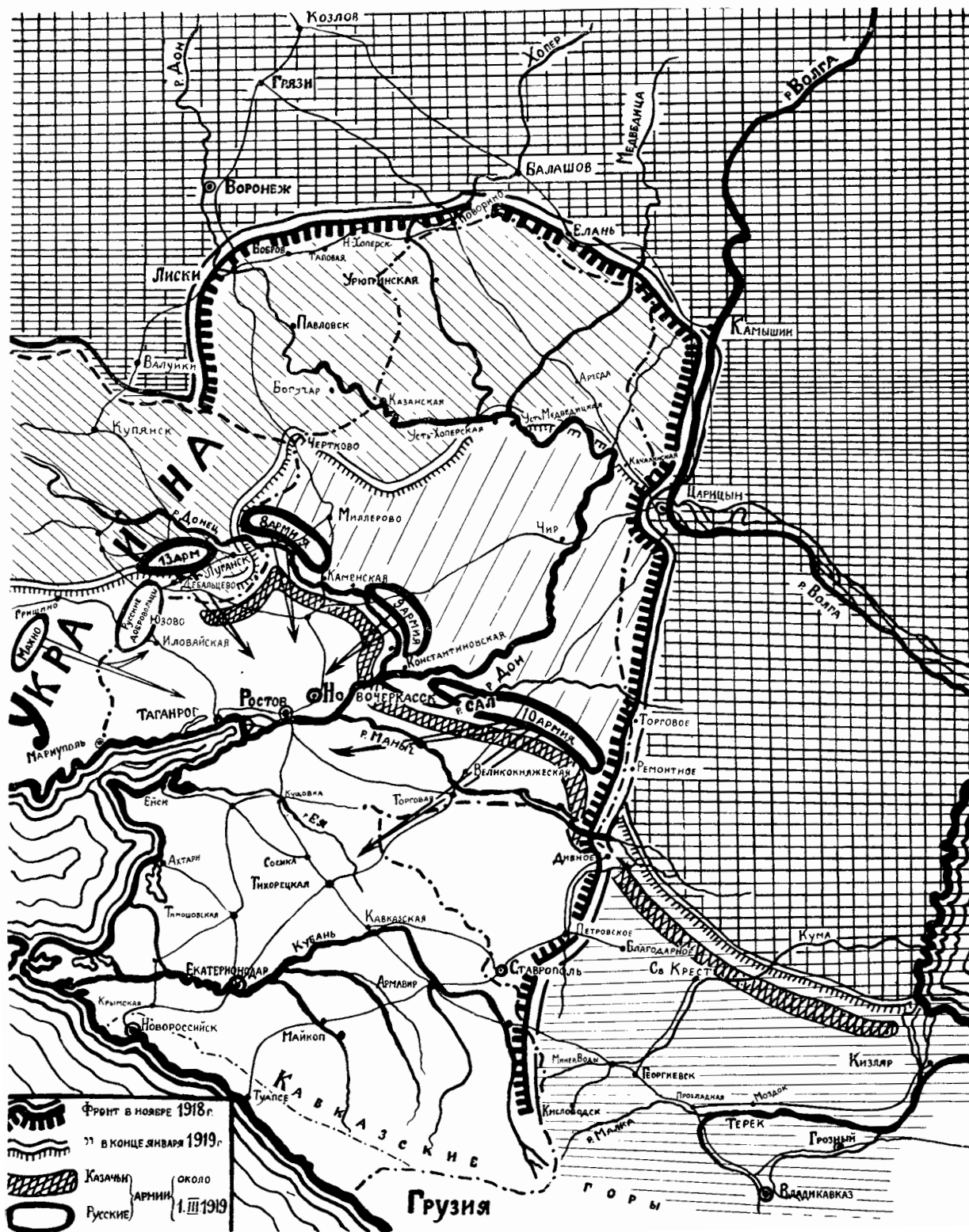
Схема: 2, 3, 4.

„вновь приобщить край к русской государственности“. (Из письма ген. Деникина к ген. Ляхову, Деникин. Очерки, т. IV, стр. 114).