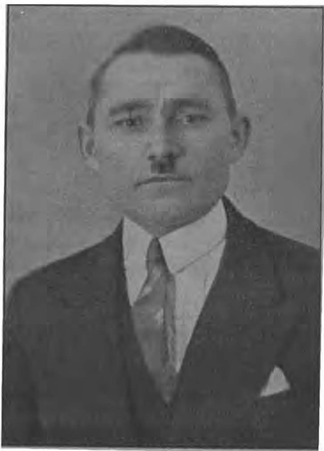
† Г. И. Барсов.