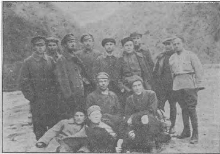
Казачи на чужбине..

По окончании антибольшевицкой борьбы в Казачьих Землях, за границей оказались тысячи молодых людей, продолжение образования которых было прервано большевицкой резней. Очувтившись за границей, молодые люди некоторое время, одни дольше, другие короче, находились под влиянием разных штабов и высоких особ из Добармии. Но более энергичные и смелые скоро разобрались в обстановке и поняли, что необходимо делать. В университетские центры, в культурные страны, для продолжения образования! Вот клич, который уже в 1920—21 годах звучал во всех эмигрантских и беженских лагерях на Балканах.