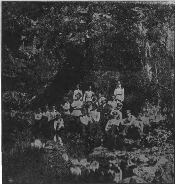
Кадеты на экскурсии в Герцеговине.

Однако, молодые казаки интуитивно чувствовали, что не отзвучали в шуме угасших поколений идеи, за которые казачество боролось в свое время, вокруг которых оно спланивало вдохновенно тысячи людей. Нажим усиливался. Центральные фигуры, именно те лица, которые политически и морально были максимально ответственными за „московский гнет“, на которые особенно четко фиксировались ненависть и гнев казачат, были вне сферы формальной досягаемости, поэтому кадеты почувствовали, что нужна исключительная конспиративность, организованность и казачье самовоспитание. С этого времени Донской Корпус становится молодым фокусом нарастающего казачьего движения, лабораторией, в которой выработывалась благородная энергия казачат, источник коллективного действия, здесь они закаляют свой дух, закладывают настоящие казачьи основы внутреннего управления и погружаются