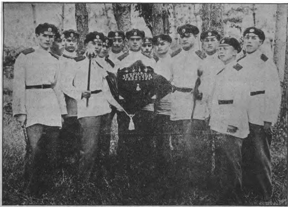
Донские кадеты XXXV выпуска.

Первоначальное местопребывание Корпуса в Югославии был лагерь Стрнище, расположенный в глубине дремучего леса и бывшего некогда австрийским лагерем для военнопленных, среди которых были и каза-