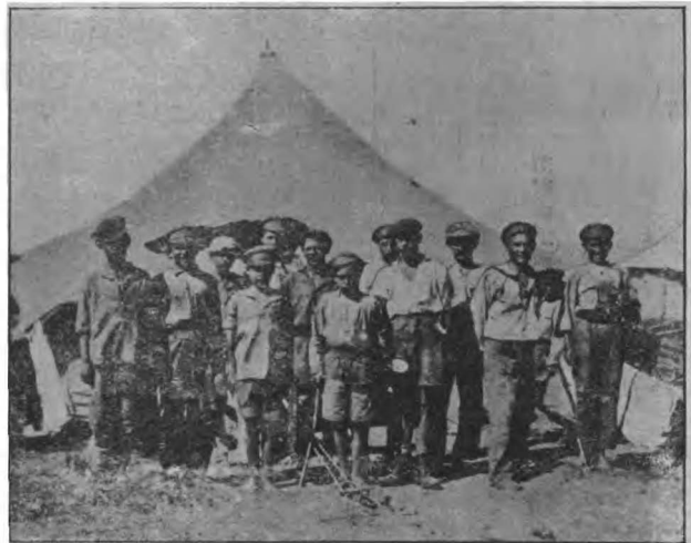
Кадеты в Варне.

В начале 1922 года появились первые сведения о том, что Корпус и все беженские части в Египте будут перевезены на Балканы. Но этому сообщению не придали большого значения. Занятия шли, уже состоялась второй „египетский“ выпуск кадет; жизнь шла наложенным руслом. И вдруг слухи эти оказались справедливыми. Последовало официальное распоряжение. Это произвело ошеломляющее впечатление. Для кадет Египет стал уже родным. Налаженная школьная машина стала. Никакие ходатайства не помогали и, наконец, лагерь загудел, собираясь в путь — в новые земли. Проехав из Александрии на английском пароходе „City of Oxford“ знакомую дорогу по Средиземному морю, оставив часть младших кадет, в образованной в Буюк-Дере Russian School, с плачем расставшихся со сверстниками, Донской Корпус прибыл в Варну. Здесь жизнь пошла иначе. Ни о каких занятиях думать не приходилось. Сразу же началось распыление, кадеты обтрепались, потеряли прежний вид, изменились внешне и духовно. Никакими усилиями „Египетский Корпус“ спасти не удалось. В Варне закончилось его существование. Старшие кадеты уехали кто куда — несколько человек в Атаманское Военное Училище, более молодые переехали в Шуменскую русскую гимназию и Тшебовскую. Остальные рассыпались по всему свету.