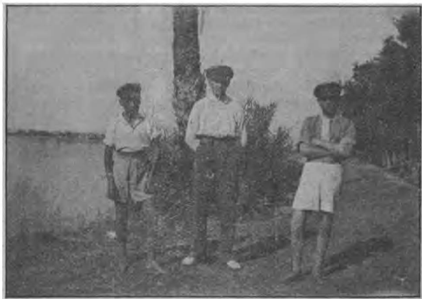
Донские кадеты на берегу о. Тимзах.