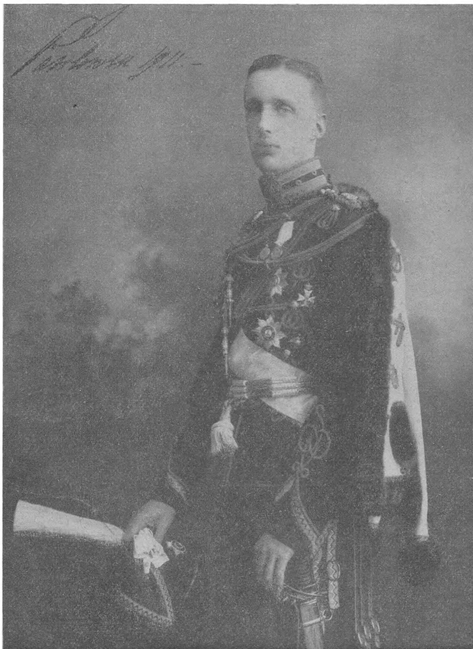
Его Императорское Высочество Великий Князь Гавриил Константинович Почетный Председатель Обще-Кадетского Объединения