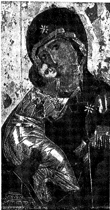
Владимірская икона Божіей Матери

ство во Владиміръ за иконой Божіей Матери. Когда шествіе съ иконой приблизилось къ Москвѣ, духовенство съ крестнымъ ходомъ и толпы народа встрѣтили икону и проводили ее до Успенскаго собора, гдѣ она и была поставлена. Здѣсь всѣ объединились въ горячей молитвѣ Царицѣ Небесной. Въ это время Тамерланъ дремалъ въ своемъ шатрѣ и увидѣлъ великую гору, съ вершины которой къ нему шло много святителей, а надъ ними