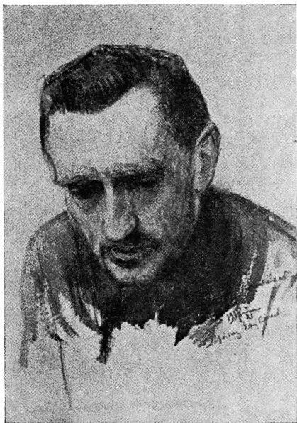
Портрет писателя, 1917 год.