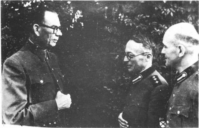
Берлин. 1943 г. Генерал Власов беседует с кап. Эрстовым и полк. Кромиади.