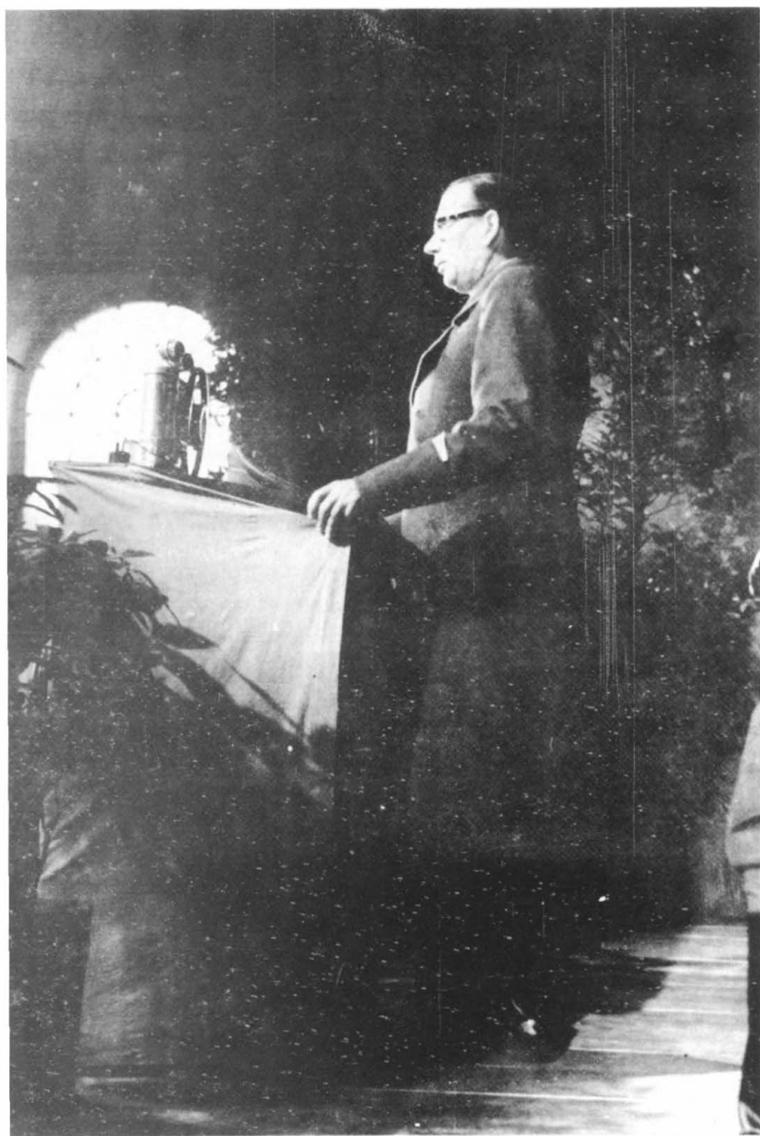
Берлин. 1944 г. Генерал Власов выступает перед военнопленными, освобожденными из лагерей.