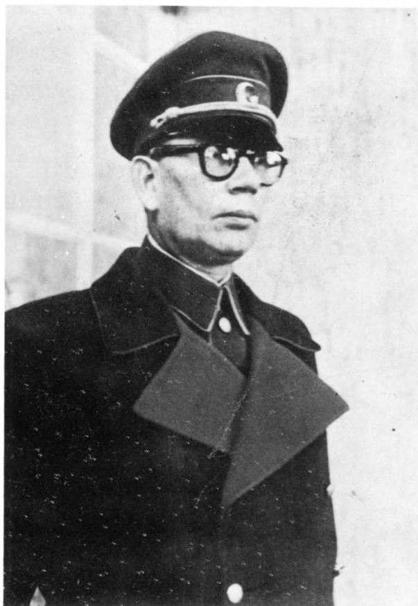
Генерал-Лейтенант Андрей Андреевич БЛАСОВ