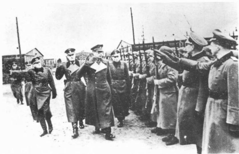
Берлин-Дабендорф. 1944 г. Ген. Власов и ген. Трухин обходят строй окончивших Школу пропагандистов РОА. (Слева кап. Штрик — Штрикфельд — представитель немецкого командования).