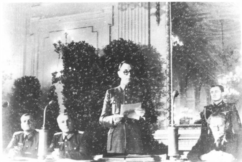
Прага. 1944 г. Президиум заседания КОНР'а. (Слева направо: ген. Трухин, ген. Жиленков, ген. Власов, проф. Руднев. Стоит полк. И. К. Сахаров).