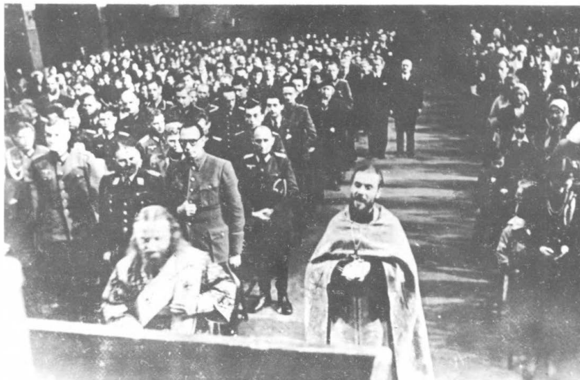
Берлин. 1945 г. Генерал Власов на детской елке для русских рабочих. Момент богослужения. (О. Александр Киселев и Ф. Иоанн Легкий).