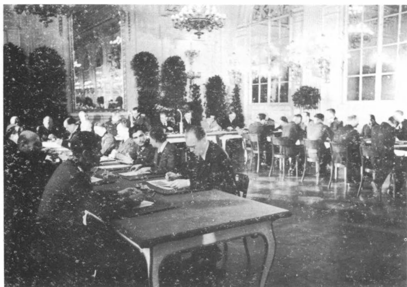
Прага. 1944 г. Заседание КОНР'а.