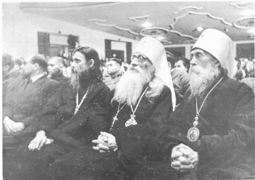
Берлин. 1944 г. В зале заседания посвященного обнародованию Пражского Манифеста. Митрополит Анастасий и митрополит Серафим.