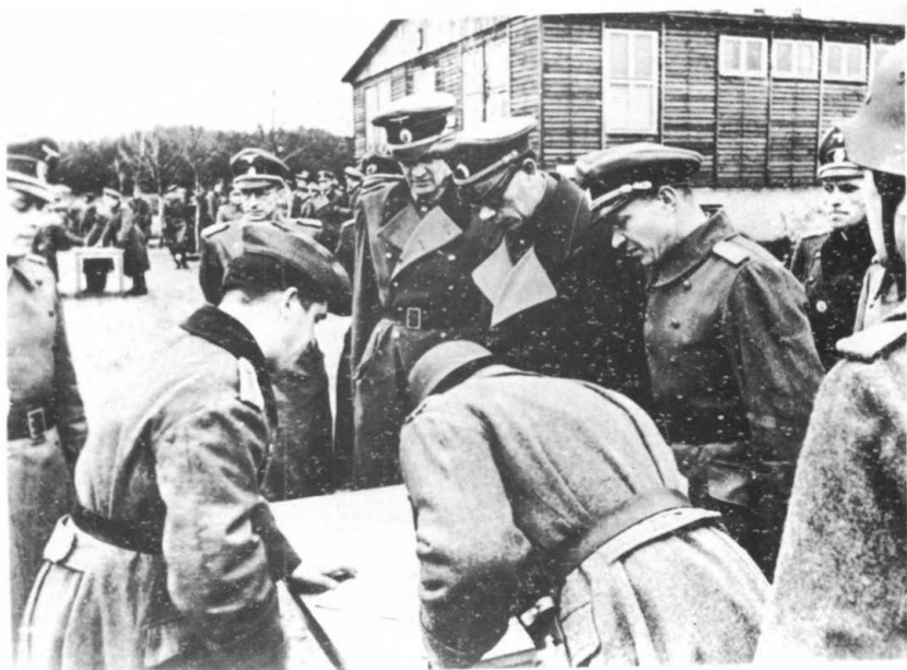
Берлин-Дабендорф. 1944 г. Ген. Власов, ген. Трухин на выпуске. Школы пропагандистов.