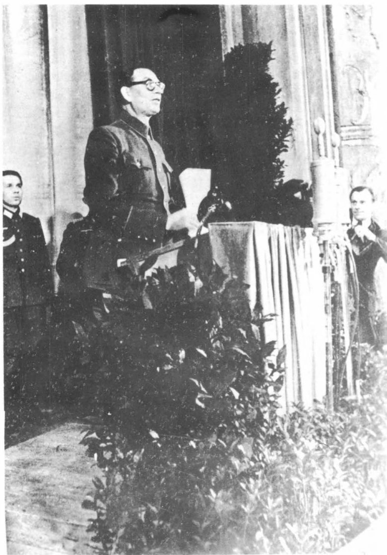
Берлин. 1944 г. Выступление председателя КОНР'а генерала Власова.