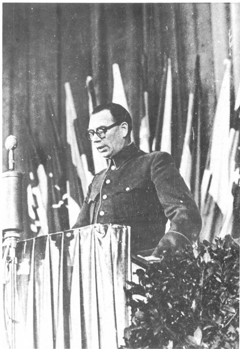
Берлин, 1944 г. Ген. Власов выступает на собрании посвященном обнародованию Пражского Манифеста