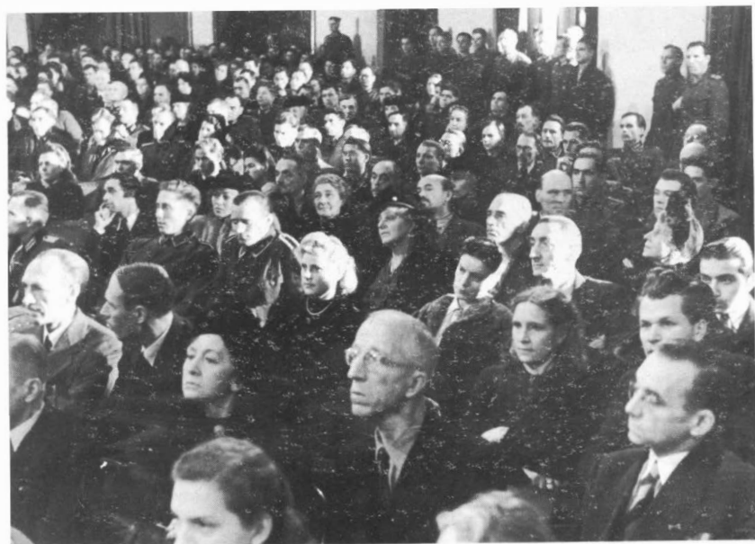
Берлин. 1944 г. Зал заседания. Публика.