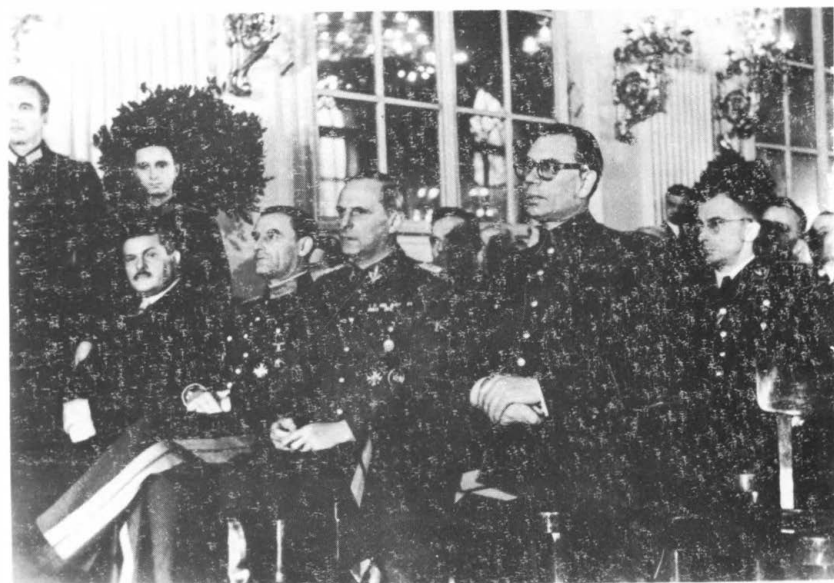
Прага. 1944 г. Ген. Власов среди приглашенных немецких гостей.