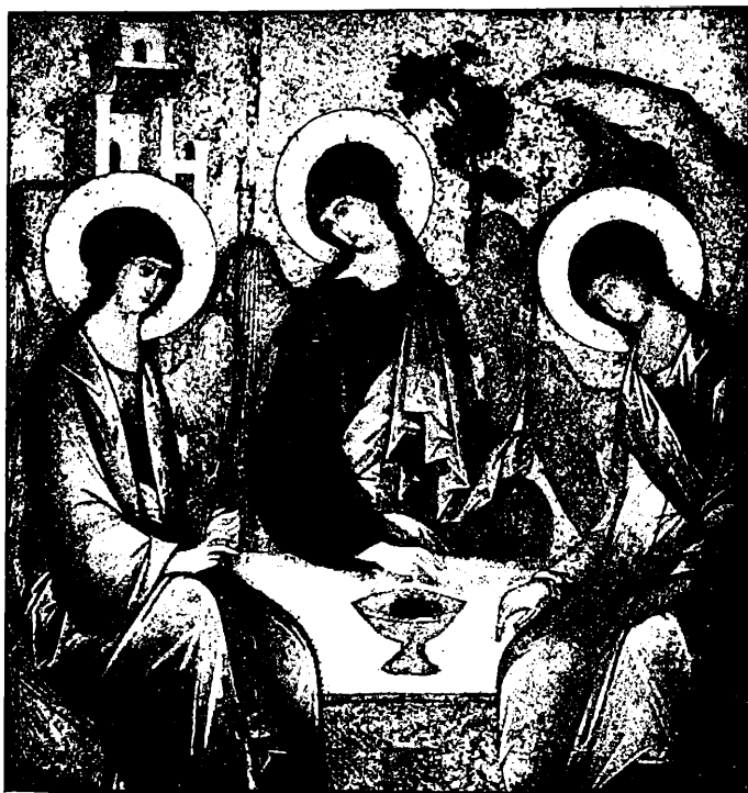
Икона Пресвятой Троицы письма Андрея Рублева.