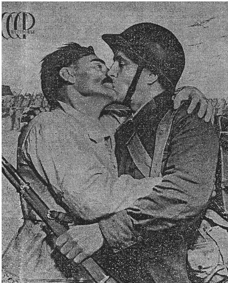
● Обложка журнала «СССР на стройке», посвященная воссоединению Западной Украины и Западной Белоруссии с Советским Союзом. 1940 год.