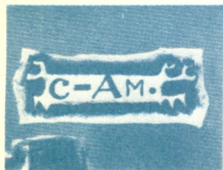
Издание журнала „А-Я“