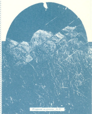
Издание журнала „А-Я“