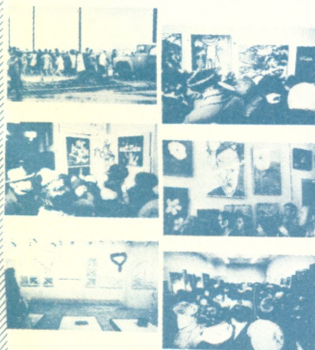
Издание журнала „А-Я“