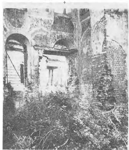
Оптина Пустынь в 1978 г. Внутренняя часть храма Марии Египетской