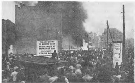
Берлинцы жгут киоск с коммунистическими газетами

нием Восточной Германии (даже многие „народные полицейские“ переходили к восставшим, а сексоты громогласно сообщали, какие они задания получили). Восстания, забастовки, демонстрации, где-то безнасиленные, а где-то сопровождавшиеся уличными боями, произошли во всех крупных городах ГДР — более чем в трехстах населенных пунктах. В действиях участвовали большие массы народа — по 60, по 80 тысяч человек. Штурмовали тюрьмы, освобождая заключенных, громили бюро СЕПГ, иногда расправлялись с особо жестокими прирешителями.